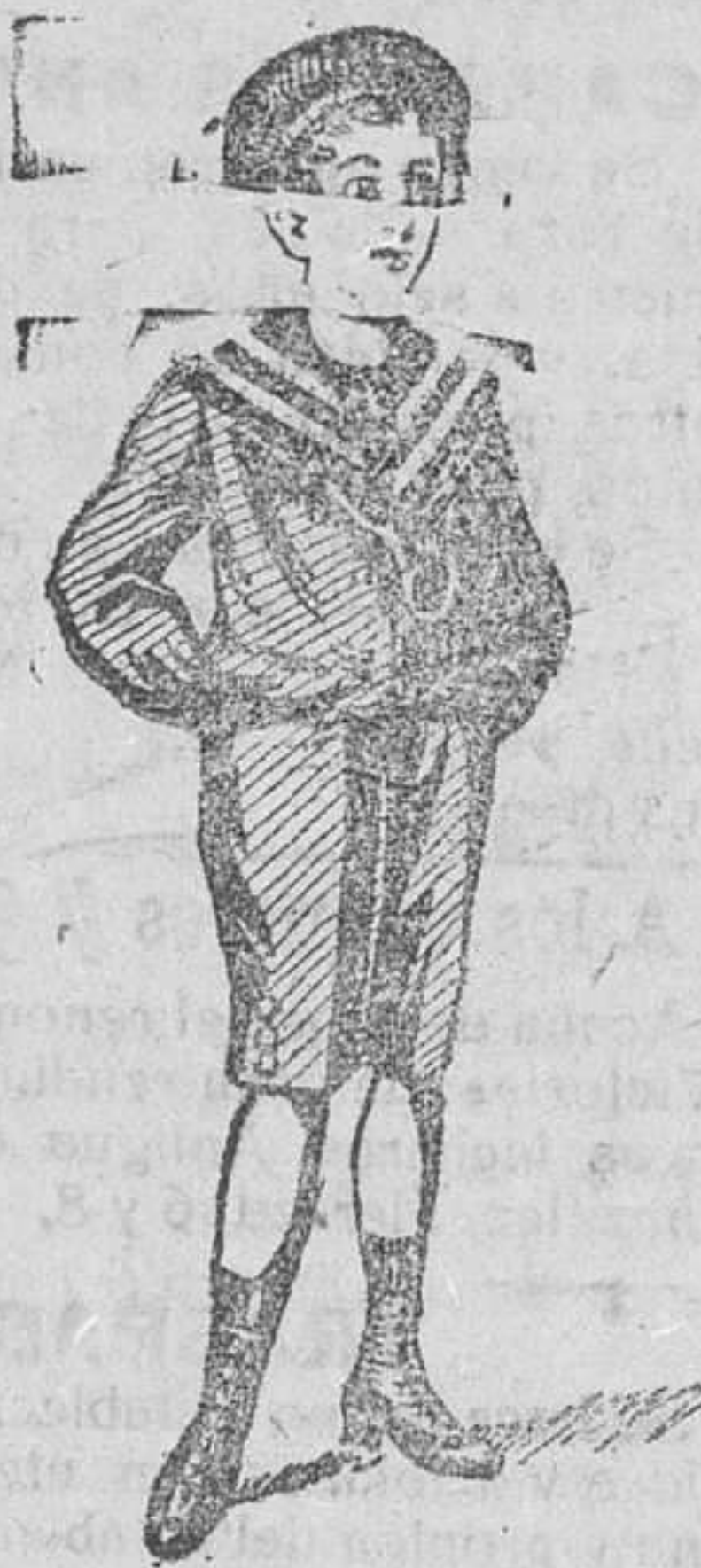
50 modelos diferentes en traqueitos de niños, en dril, paño y pana.

Visiten esta casa y se convencerán de los grandes surtidos que presenta en abrigos gabardina, trajes dril (caballero) y guardapolvos (caballero, señora y niños).