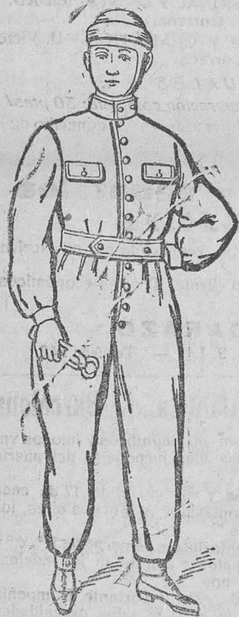
Traje guerrero y pantalón unidos, en dril azul y negro, impermeabilizados, de 14 á 30 pts.

De venta en todos los buenos establecimientos y centrales de electricidad A. E. G. Thomson Houston Ibérica S. A.—MADRID.