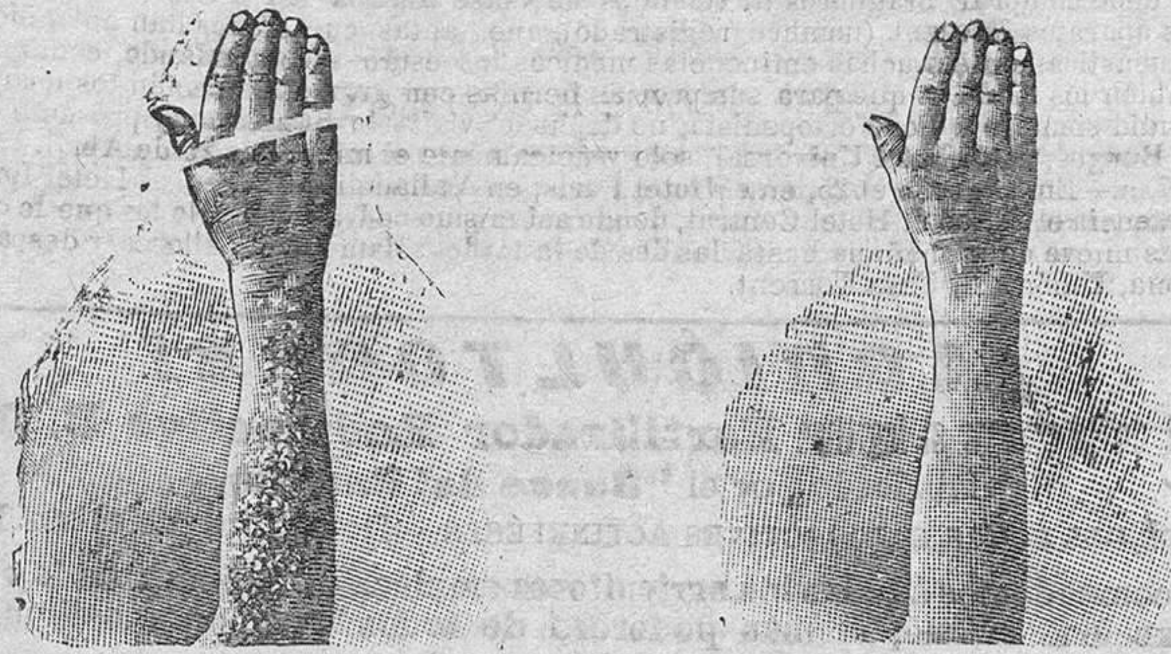
Antes de la curación A los 15 días de tratamiento

Curación radical de todas las enfermedades de la piel, de las llagas de las piernas y del artrismo, reumatismo, gota, dolores, etc., por medio del Tratamiento de L. RICHELET