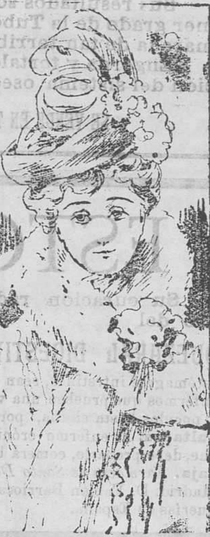
Sombrero fin de siglo

Conócese este sombrero por «Modelo Berliendi».