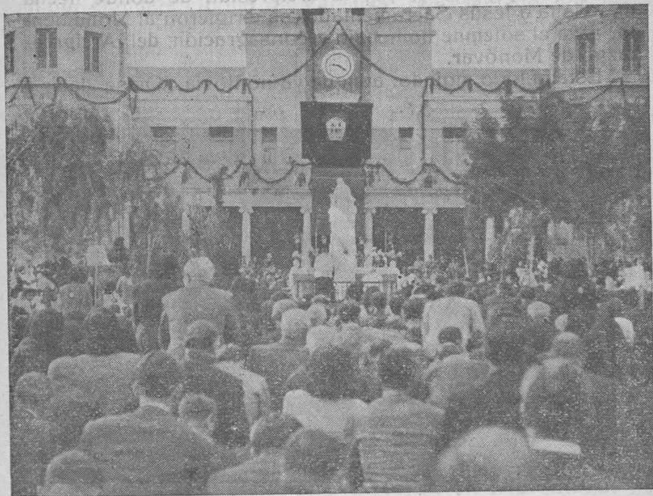
La Misa inaugural del Monumento de Monóvar, celebrada por el Excmo. señor Obispo de la Diócesis

Seguidamente comenzó la misa, y antes de la comunión, en la que recibieron el pan de los ángeles más de un millar