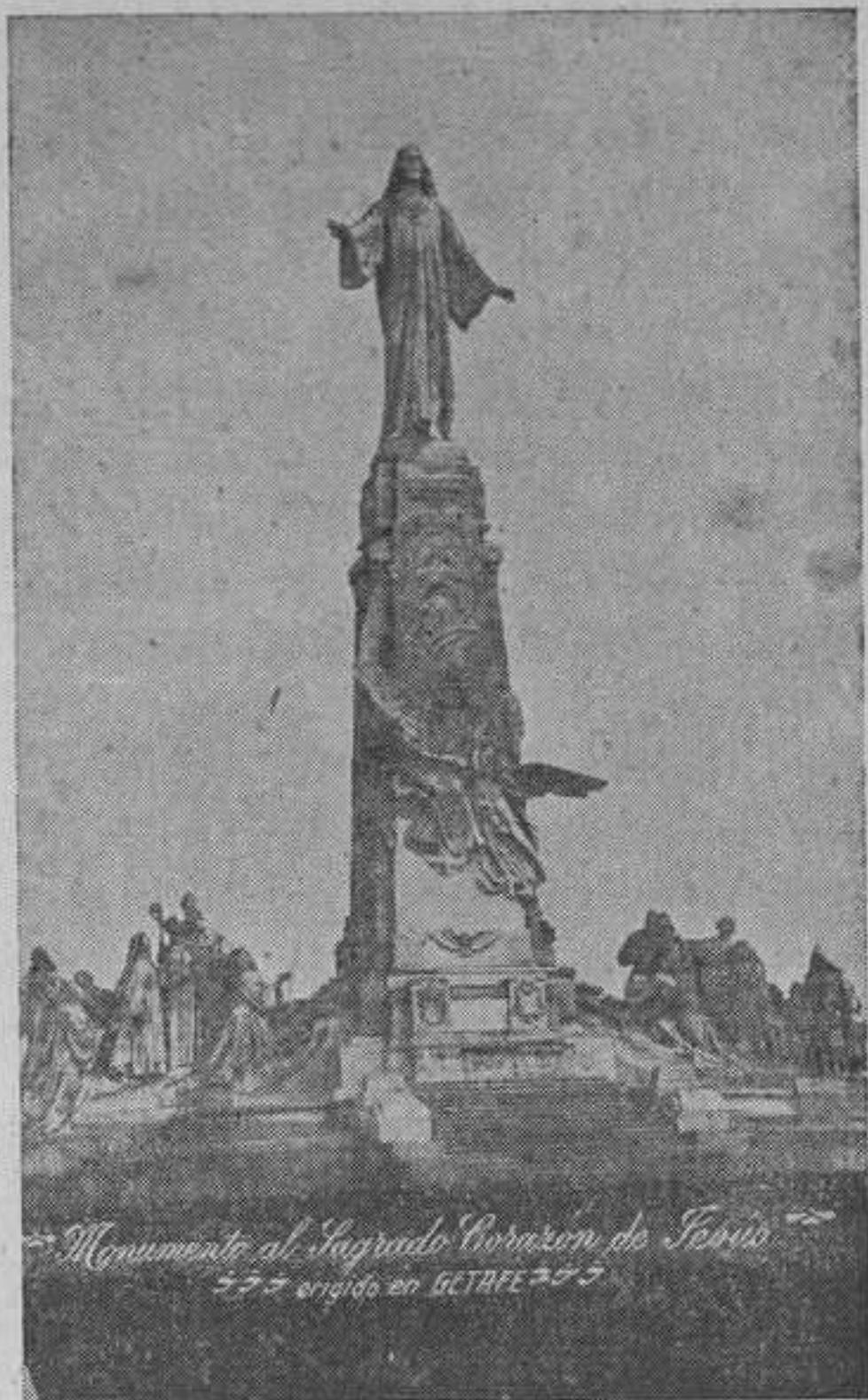
El Monumento del Cerro de los Angeles

estatua, donativo particular del Conde de Guaquí, costó 50.000 (cincuenta mil) pesetas. Sobre una gran plataforma alzabase el altar, apoyado en el grandioso pedestal, que ostentaba en su parte alta la inscripción: «REINO EN ESPAÑA»; en su centro una Inmaculada en bajo relieve; y poco después de su arranque un grandioso escudo de España sostenido por dos ángeles gigantes, todo ello en alto relieve. La Estatua, que coronaba este pedestal de unos 20 metros de altura, medía nueve metros. Y hoy está felicísimamente reproducida, por Cuñat, en nuestro Monumento regional de Valencia, en Real de Gandía.