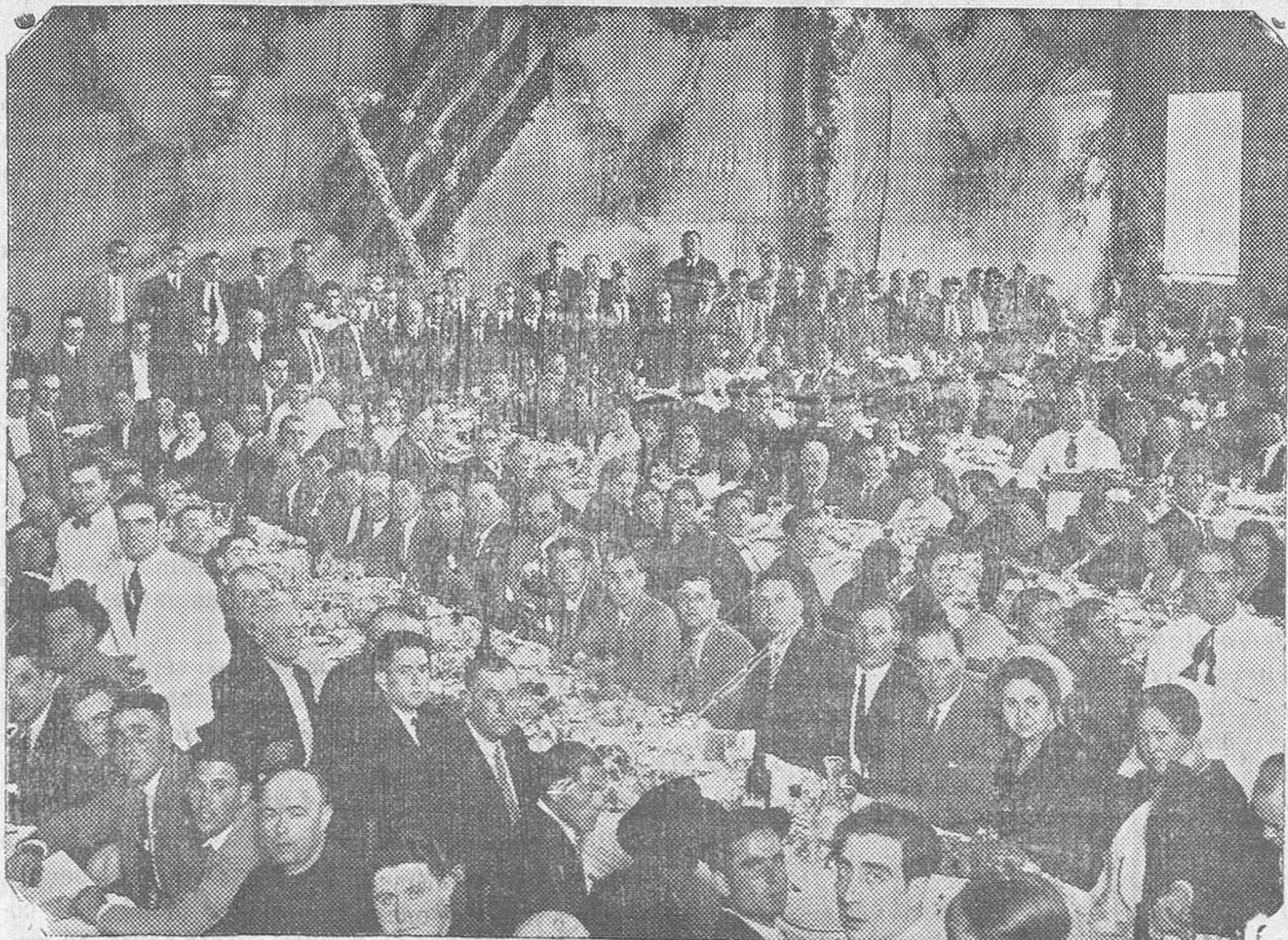
Un aspecto del banquete

Plaza del Cabo Pastor nº. 10 VALEN CIA: Martínez Cubells 8