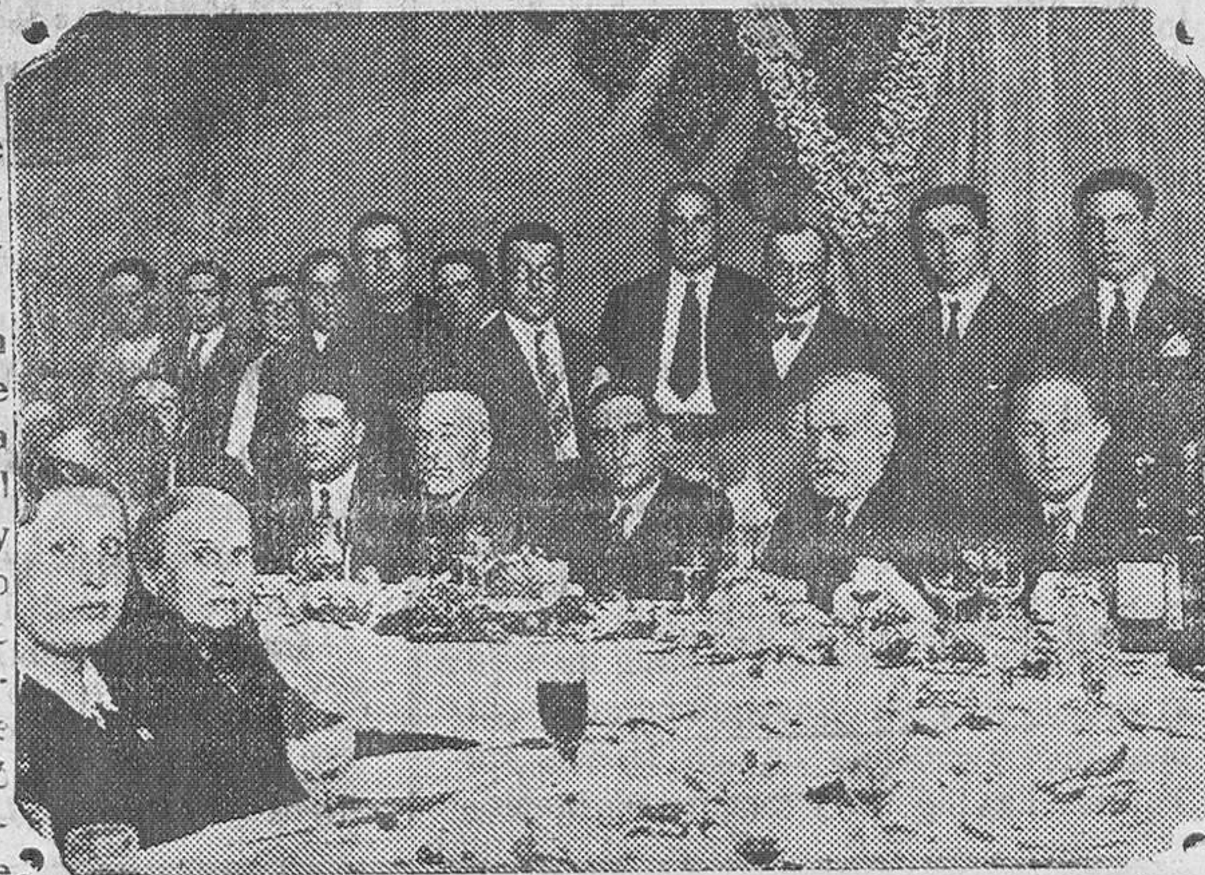
Mesa presidencial del Banquete