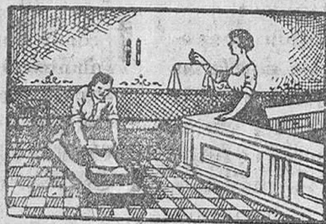
MAR CA REGISTRADA