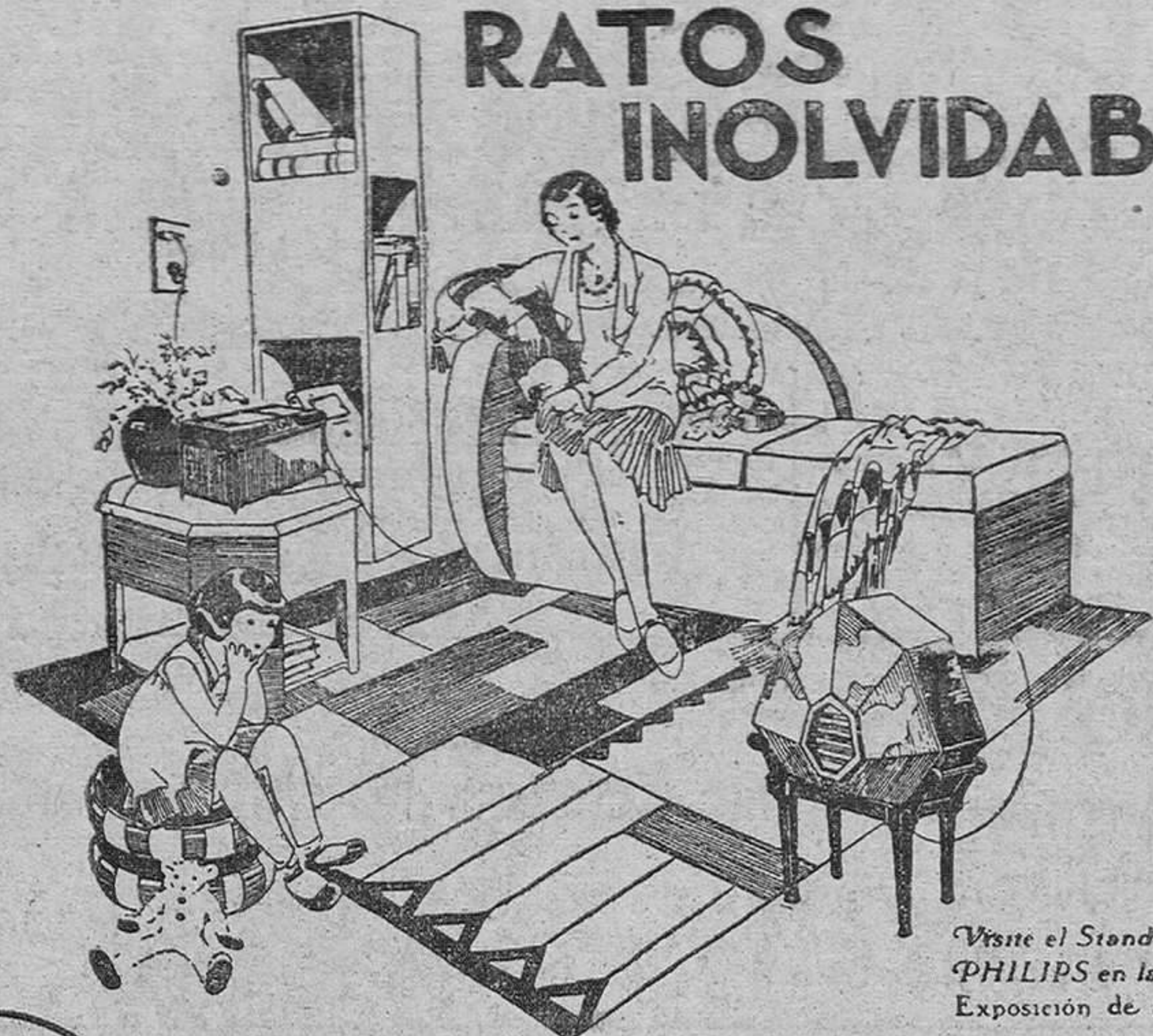
Visite el Stand PHILIPS en la Exposición de Sevilla

Ratos inolvidables de deleite espiritual proporcionan a sus poseedores el RECEPTOR PHILIPS DE LUJO, CON ENCHUFE A LA LUZ Y CON ALTA VOZ ELECTRODINÁMICO. Los más grandes artistas dentro de cada hogar, con fidelidad asombrosa de reproducción y a través de un aparato que es realmente un objeto de arte.