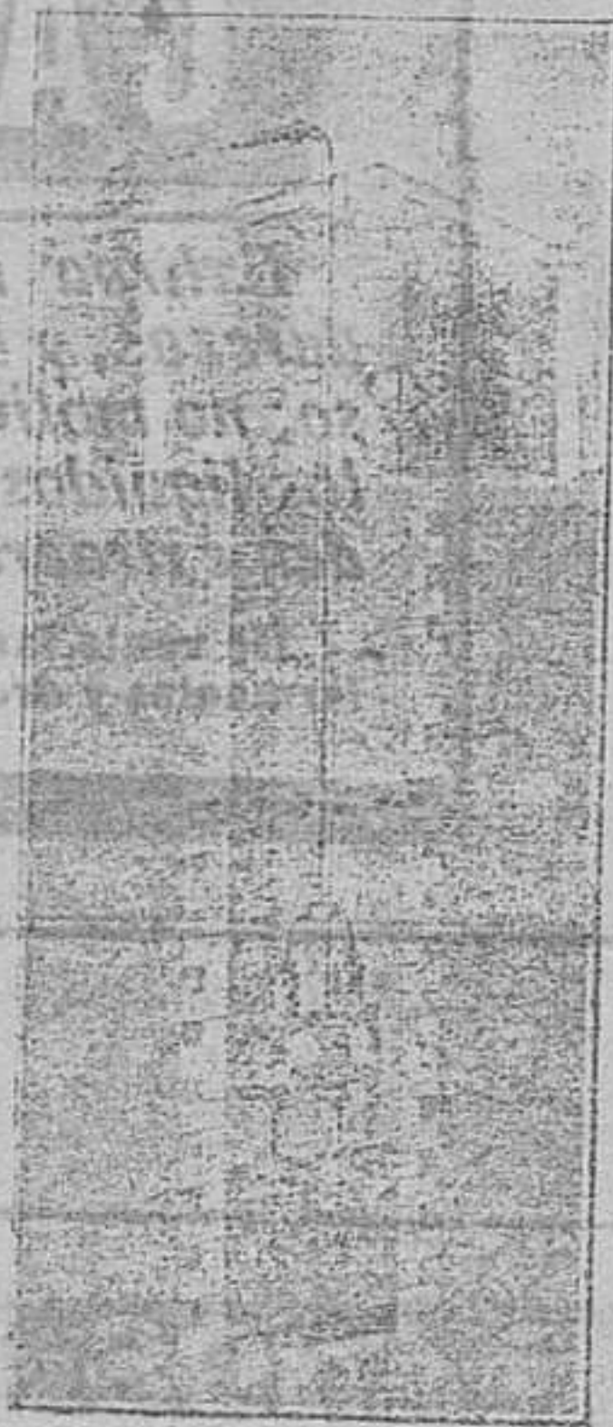
Detalle de la ilustración de la fábrica.