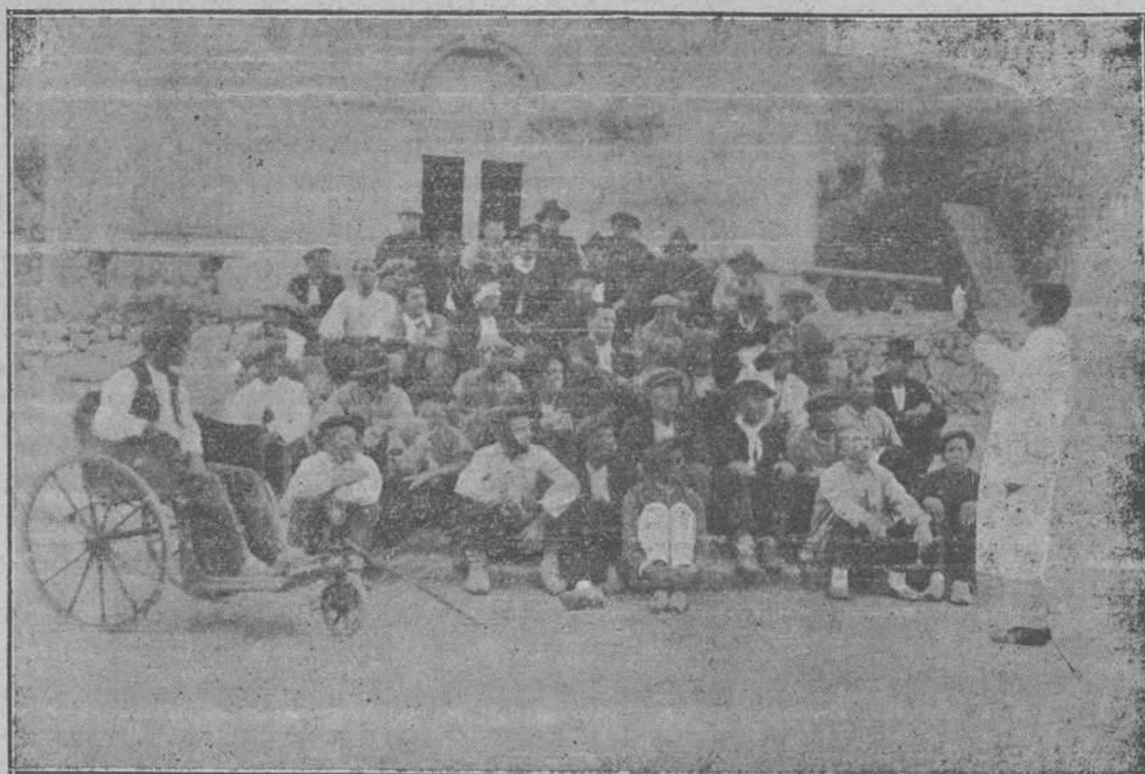
UN GRUPO DE ENFERMOS LLENOS DE ÚLCERAS

Ejercicios Espirituales. — El día 15 co-