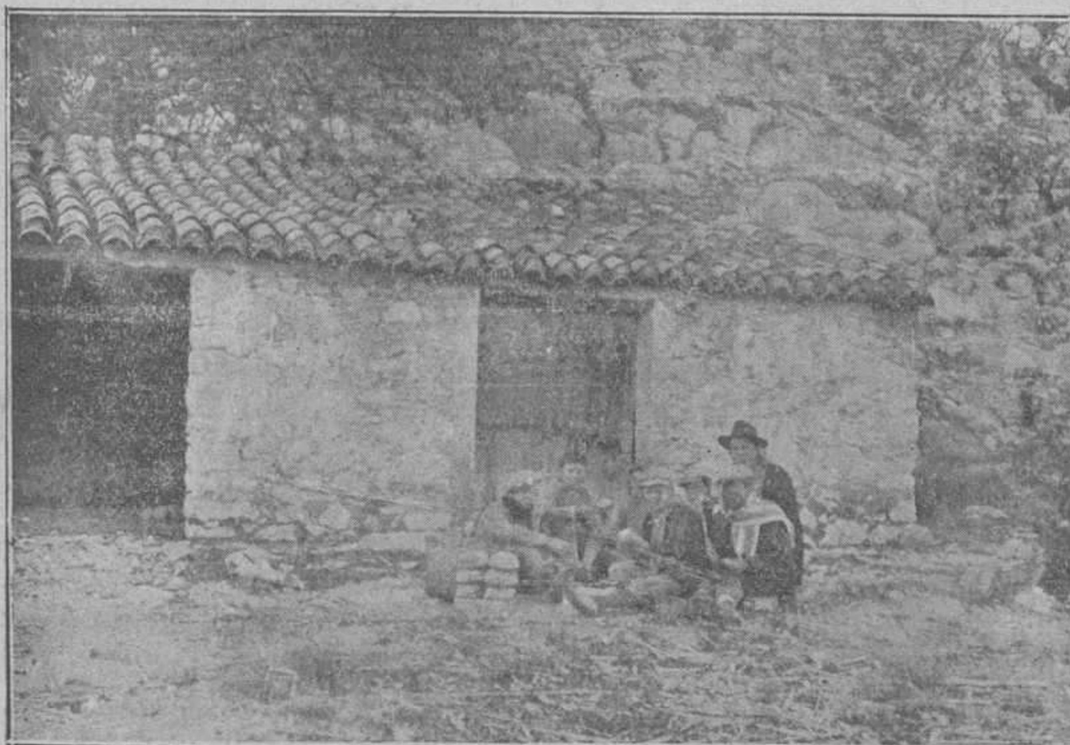
UN DÍA DE CAMPO

Fiesta de Santa Cecilia. — Como es la patrona de los cantores, se han lucido de un modo extraordinario por más que se lucen siempre que abren su boca por estropeada o llagada que la tengan. Durante toda la Misa y Comunión cantaron hermosos mote-tes y el precioso himno de la Santa, que repitieron con otros cantos en la función de la tarde. Después tuvieron una buena merienda-cena que sabía a gloria y