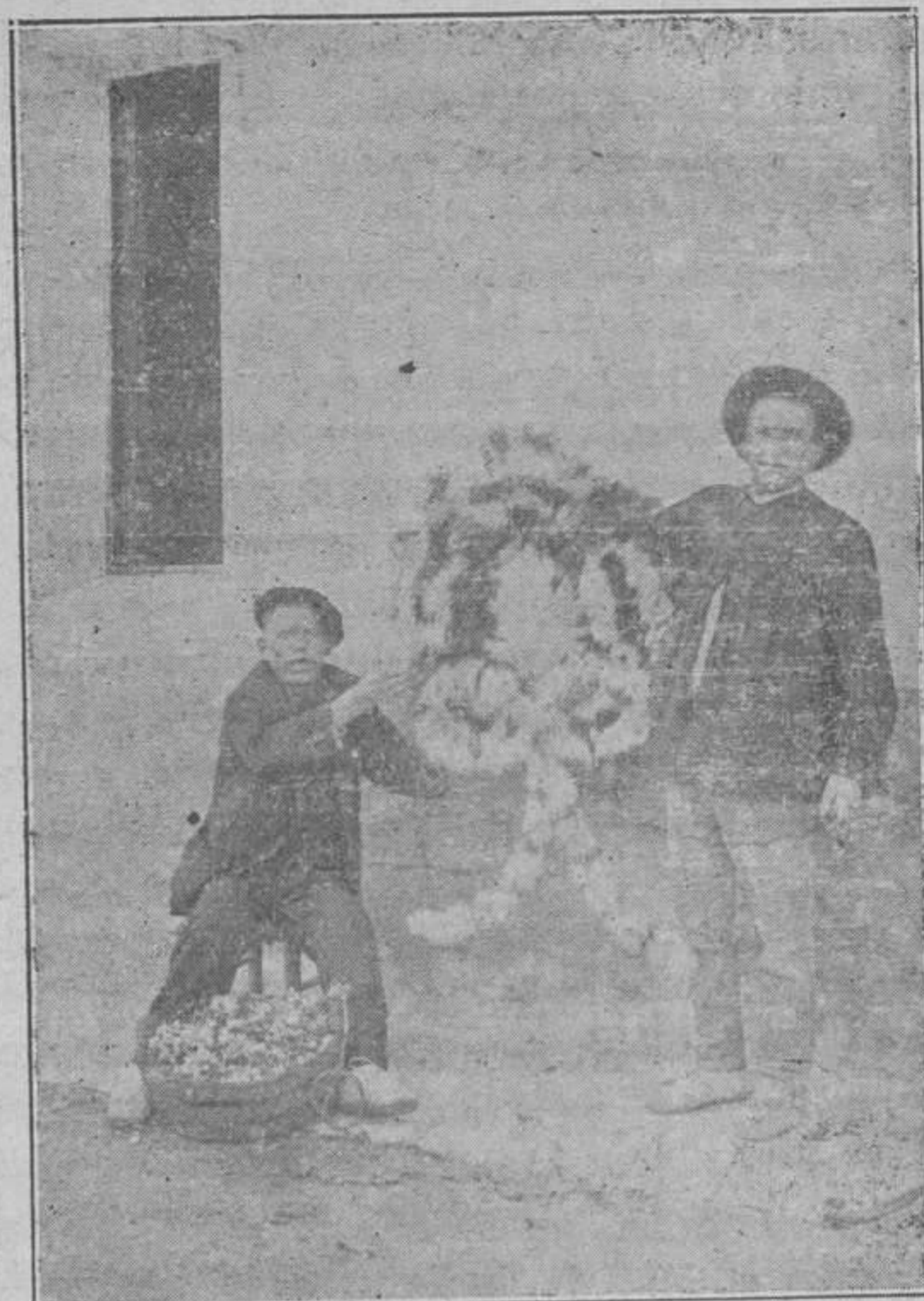
TERMINANDO LA CORONA

Se nos dirá quizá: Pues ¿que no hay religión más que en España? La Religión verdadera, que es la Católica, está extendida por todas partes, pero la fe, que es semilla del cielo, necesita para su desarrollo corazones bien preparados y cultivo esmerado; y la emigración ni es campo a propósito ni terreno abonado para ello, porque el hombre fuera de su casa y lejos de los suyos descuida el cumplimiento de sus deberes, pierde el pudor natural y se pervierte; moralmente la emigración es la mayor de todas las calamidades.