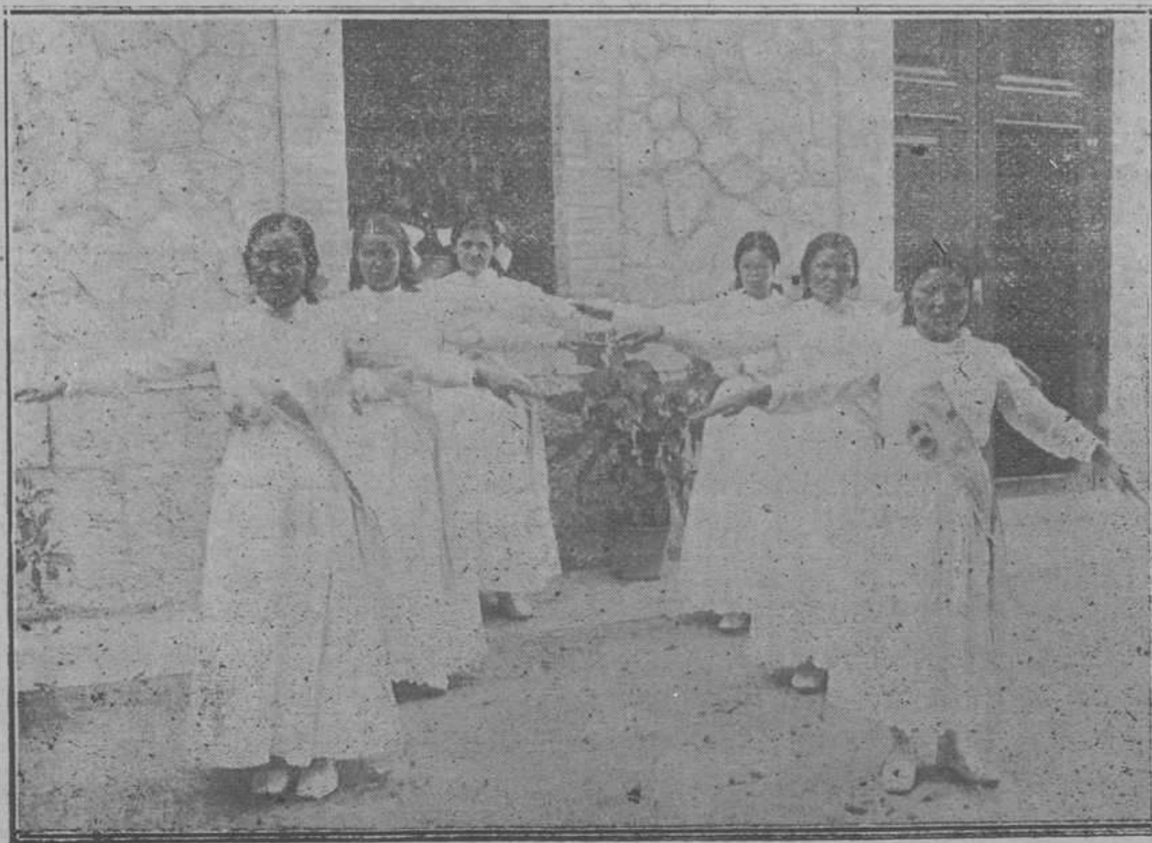
VARIAS ENFERMITAS EN EL ACTO DE GIMNASIA RÍTMICA

La velada. —El mismo día por la noche se dedicó a nuestro amado Padre Vilariño una simpática y cariñosa velada para demostrarle de alguna manera el afecto de todos hacia él. Como un testigo presencial hace ya una hermosa rese-