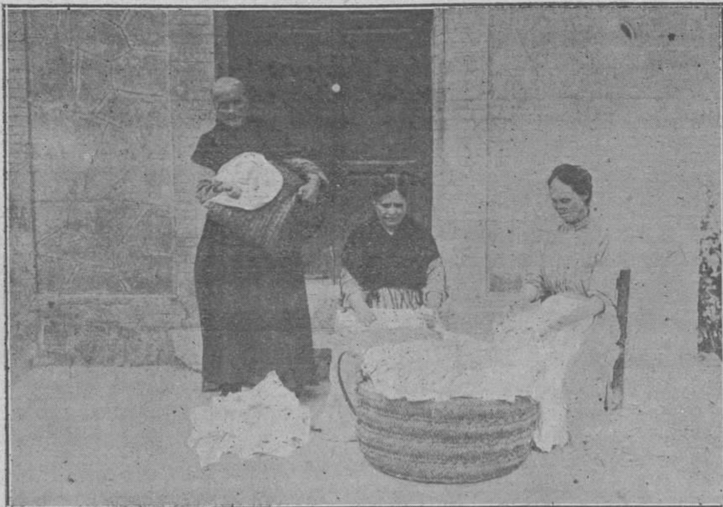
ENFERMAS COMPONIENDO ROPA