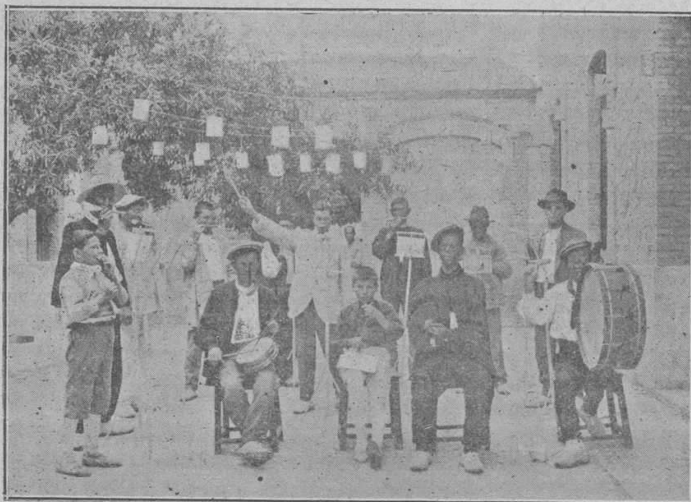
LA BANDA DE FONTILLES

lectores cómo se colocó la imagen de la Santísima Virgen en su glorioso Tránsito. Sobre una pequeña cama estaba la divina Madre recostada y durmiendo el plácido sueño de su muerte, y a su rededor se pusieron cuatro colosales albahacas con sus macetas, además de otros ramos de flores y algunos cirios. El vestido de la celestial Señora estaba ricamente bordado. Así ha estado toda la Octava de tan gran festividad delante y en el centro del presbiterio. La Misa con cantos de los enfermos que semejaban los que cantarían los ángeles al subir a su Reina hacia la gloria, y la Comunión que se dió durante la Misa con una plática preparatoria recordaban o representaban muy bien el día de la gloriosa Asunción de la Virgen, y se ofreció por la salud de unos enfermos de la familia de una señora gran bienhechora de los pobres leprositos. Por la tarde al fin de la función de la iglesia salieron todos en procesión cantando los dos últimos Misterios de gloria del santo Rosario, llevando la imagen de la Virgen