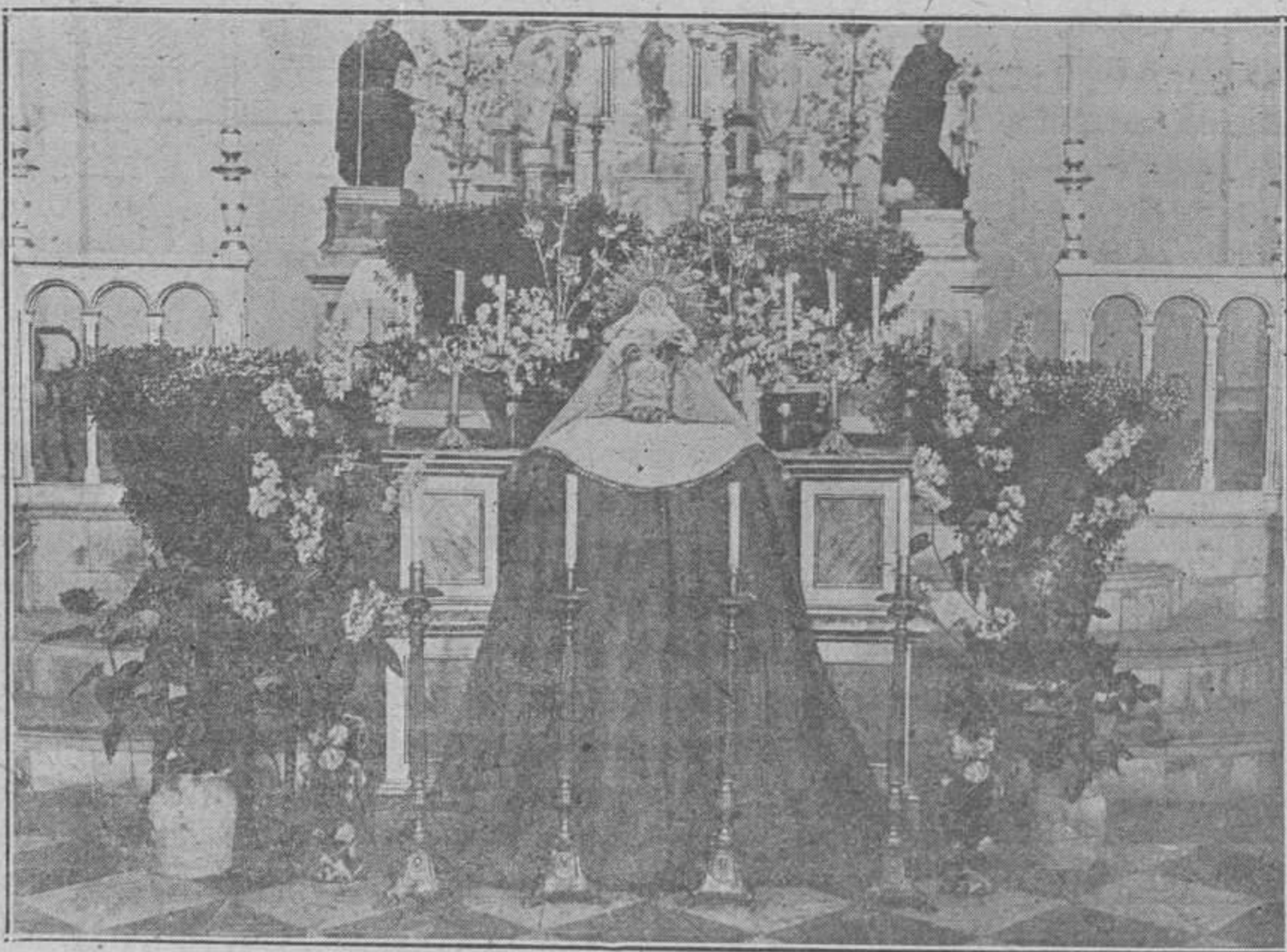
LA ASUNCIÓN DE LA VIRGEN EN FONTILLES

Fiesta de la Asunción de Ntra. Señora. — En el adjunto grabado mostramos a nuestros