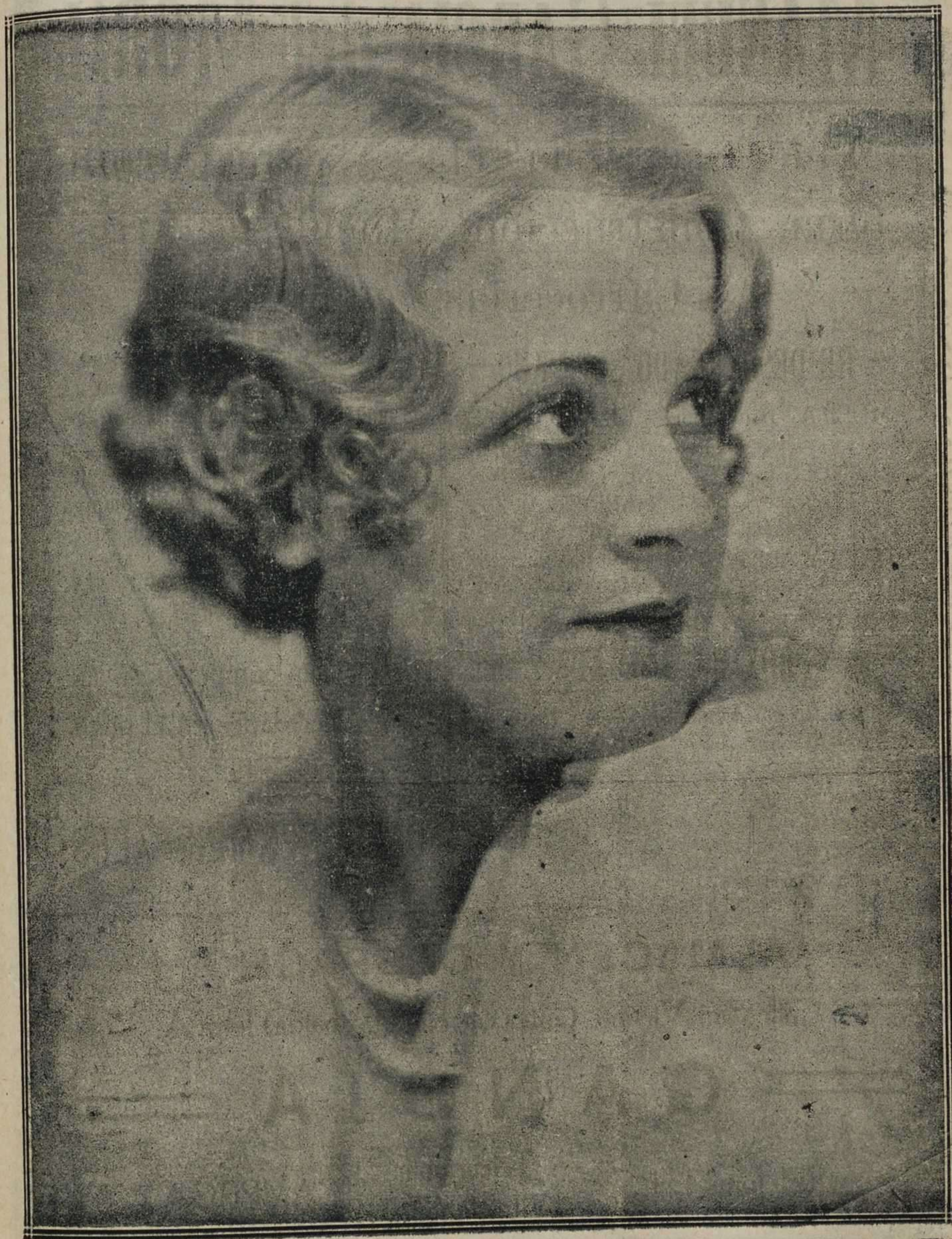
Frances Dade Graciosa artista de la pantalla que pronto admiraremos en el Gran Cine Royalty