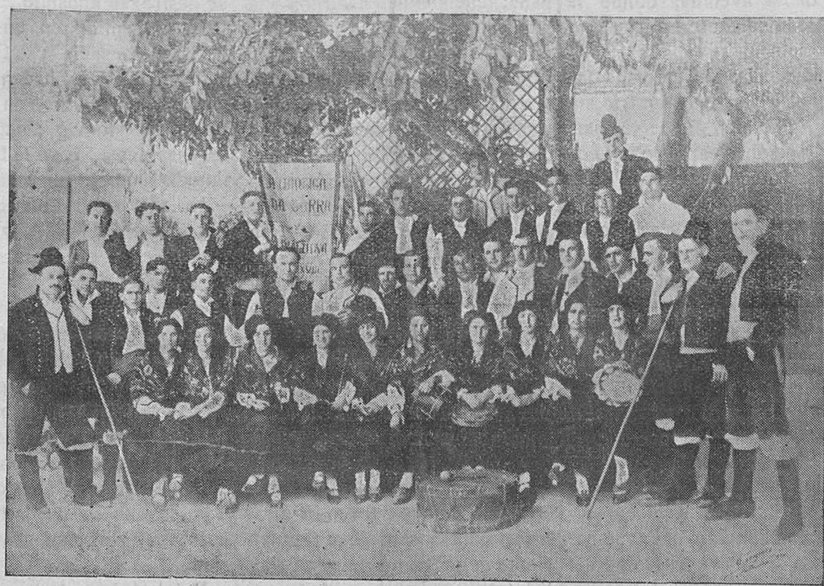
El notable coro coruñés que mañana actuará en la Plaza de Toros.