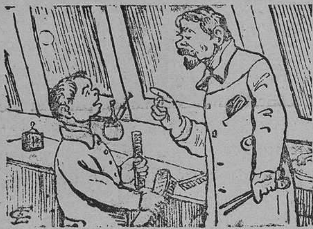
El aprendiz de peluquero

—Niño, voy á despedirte, porque los clientes se quejan de que eres poco fino con ellos.