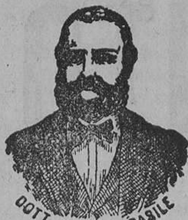
Inventor de los renombrados medicamentos CASILE

6.º A las indicadas proposiciones acompañará el documento que acredite haberse ingresado en la cuenta corriente de la Junta en la Sucursal del Banco de España, y en concepto de fianza, 25 pesetas por cada obligación, y podrán ser presentadas en la expresada oficina de Secretaría de la Junta, desde las doce del día 27 de Febrero hasta igual hora del día siguiente.