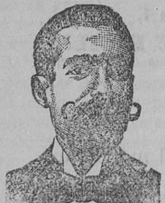
Inventor de los renombrados medicamentos

Roob Antisifilítico Inyección Vegetal COSTANZI