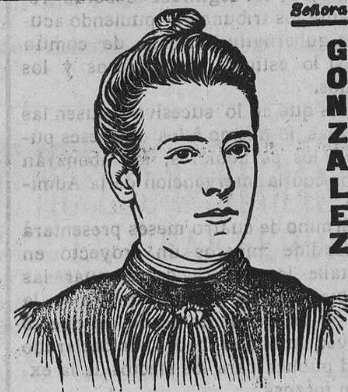
Barcelona 23 de Abril de 1901.