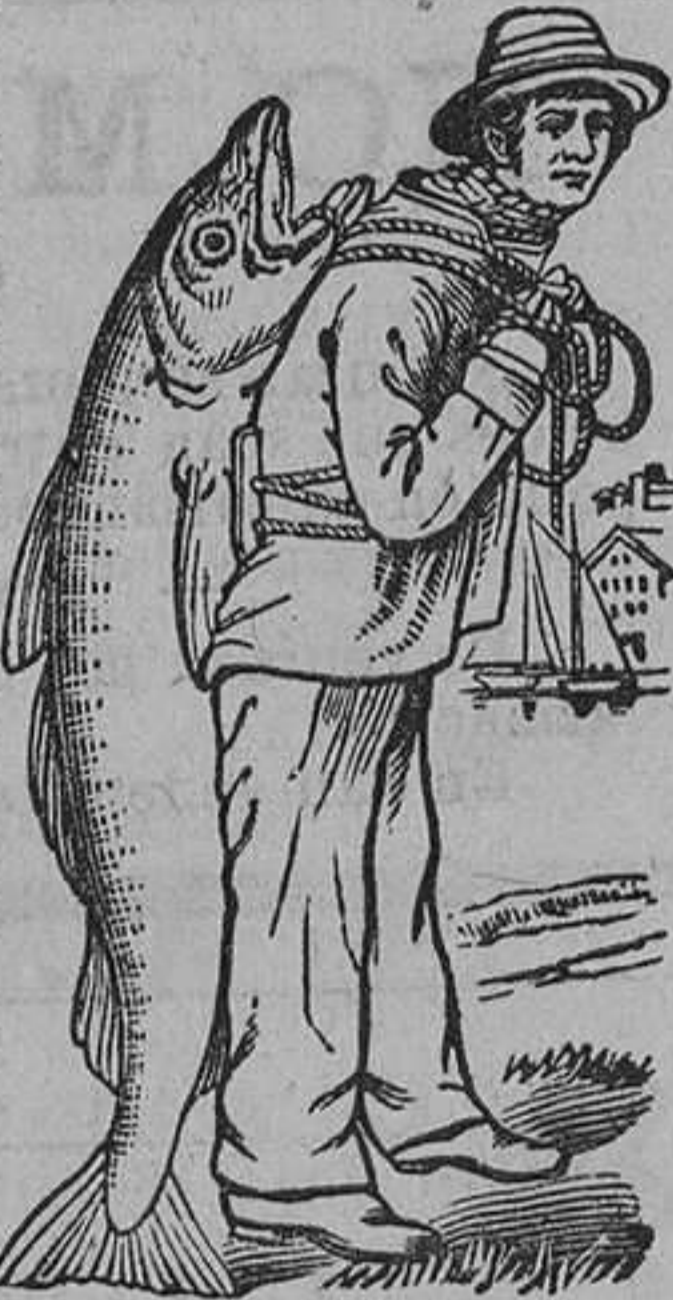
MARCA DE FABRICA