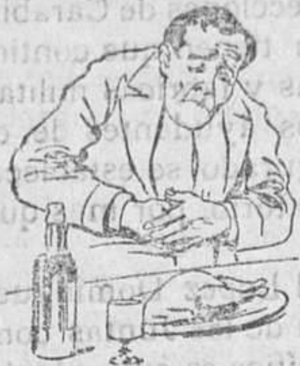
Causas de no tomar el QUEZARAL