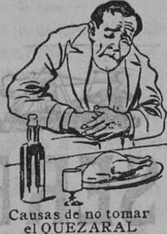
Causas de no tomar el QUEZARAL