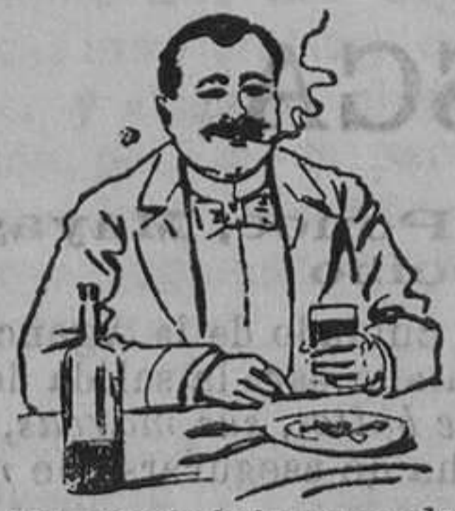
Efectos de haber tomado el QUEZARAL