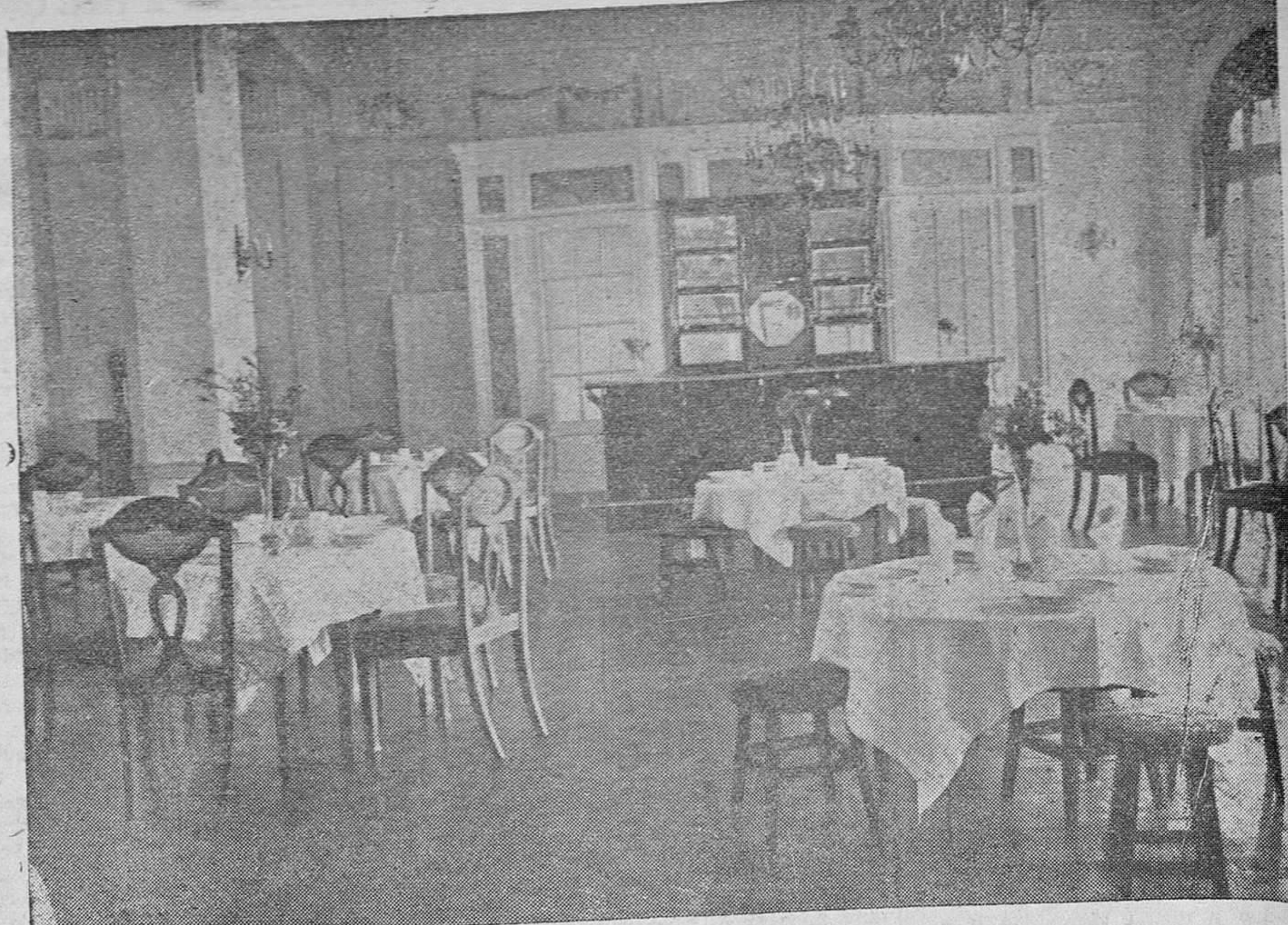
UNA GRAN OBRA SOCIAL. — Un detalle de uno de los comedores establecidos en el Orfanato del Miliciano