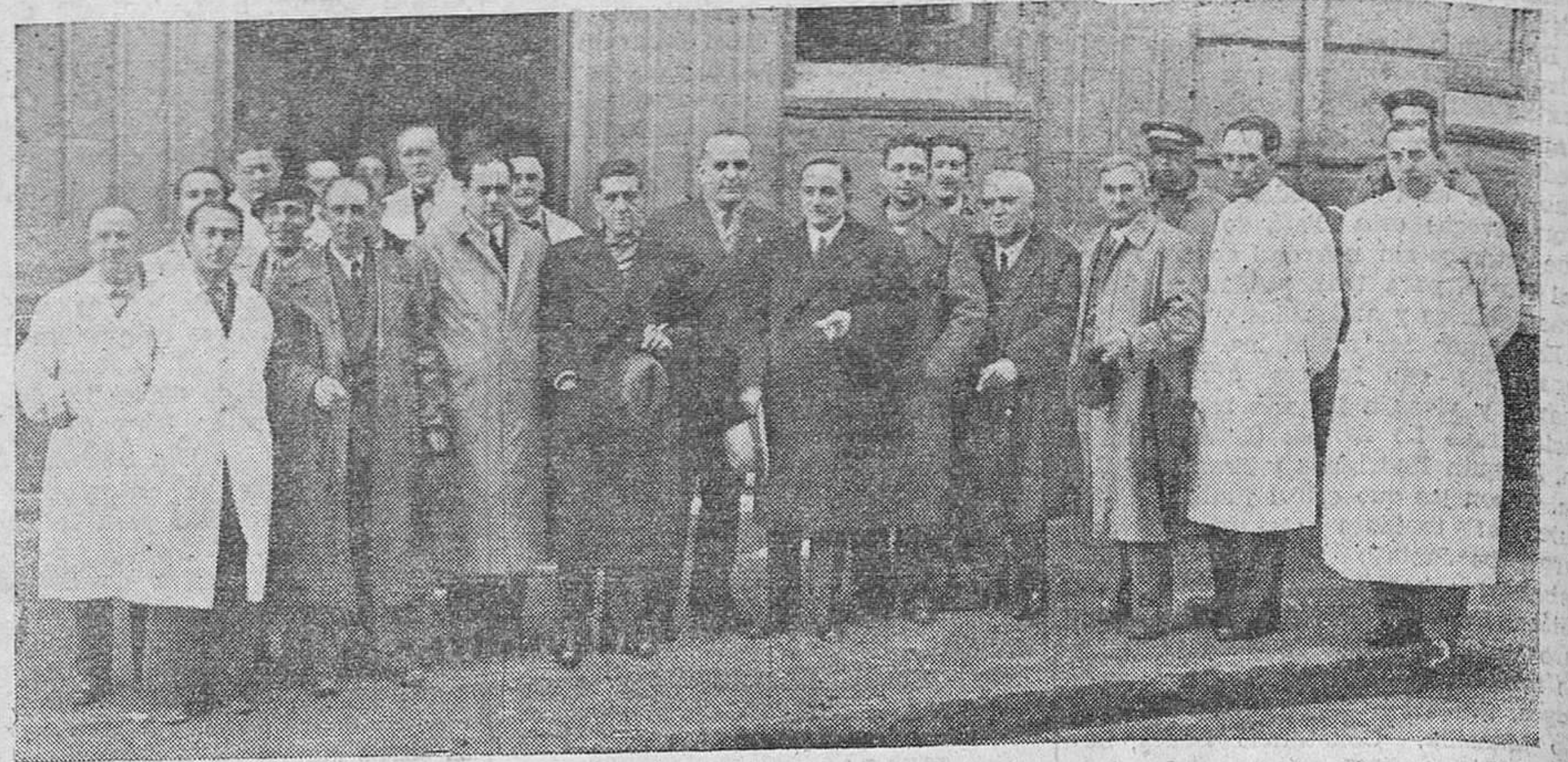
Las autoridades e invitados al acto inaugural de las importantísimas reformas introducidas en la Casa de Socorro.

A las doce del día de ayer tuvo lugar el acto de la inauguración de las obras realizadas por el Ayuntamiento en la Casa de Socorro, que ha quedado con ellas a la altura de las mejores de su clase en España y en el extranjero.