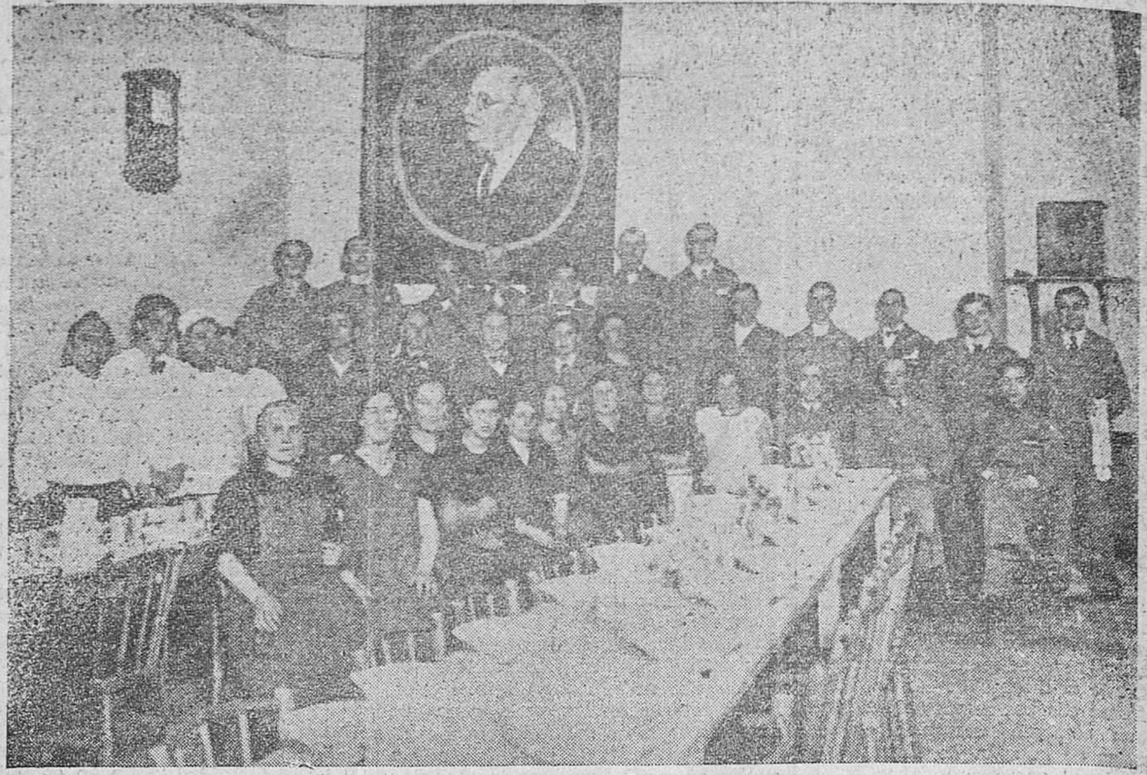
EL COMEDOR MANUEL AZARÁ. Personal que presta sus servicios en el comedor popular «Manuel Azará».