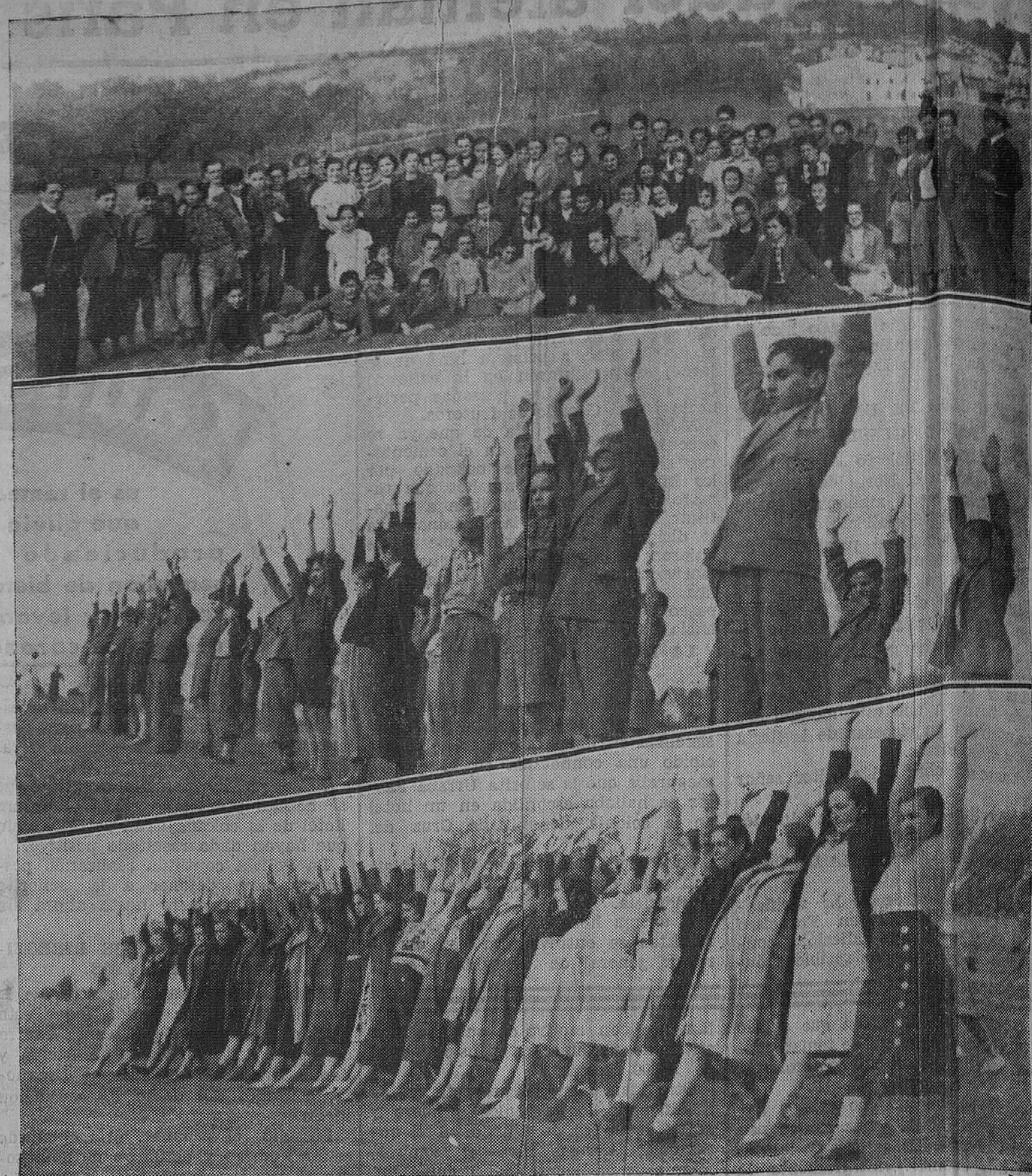
El Instituto de Menéndez y Pelayo ha inaugurado ayer unas clases de cultura física al aire libre en la Magdalena. Las fotos recogen un grupo de niños y niñas, con sus profesores, en dos momentos de la lección.