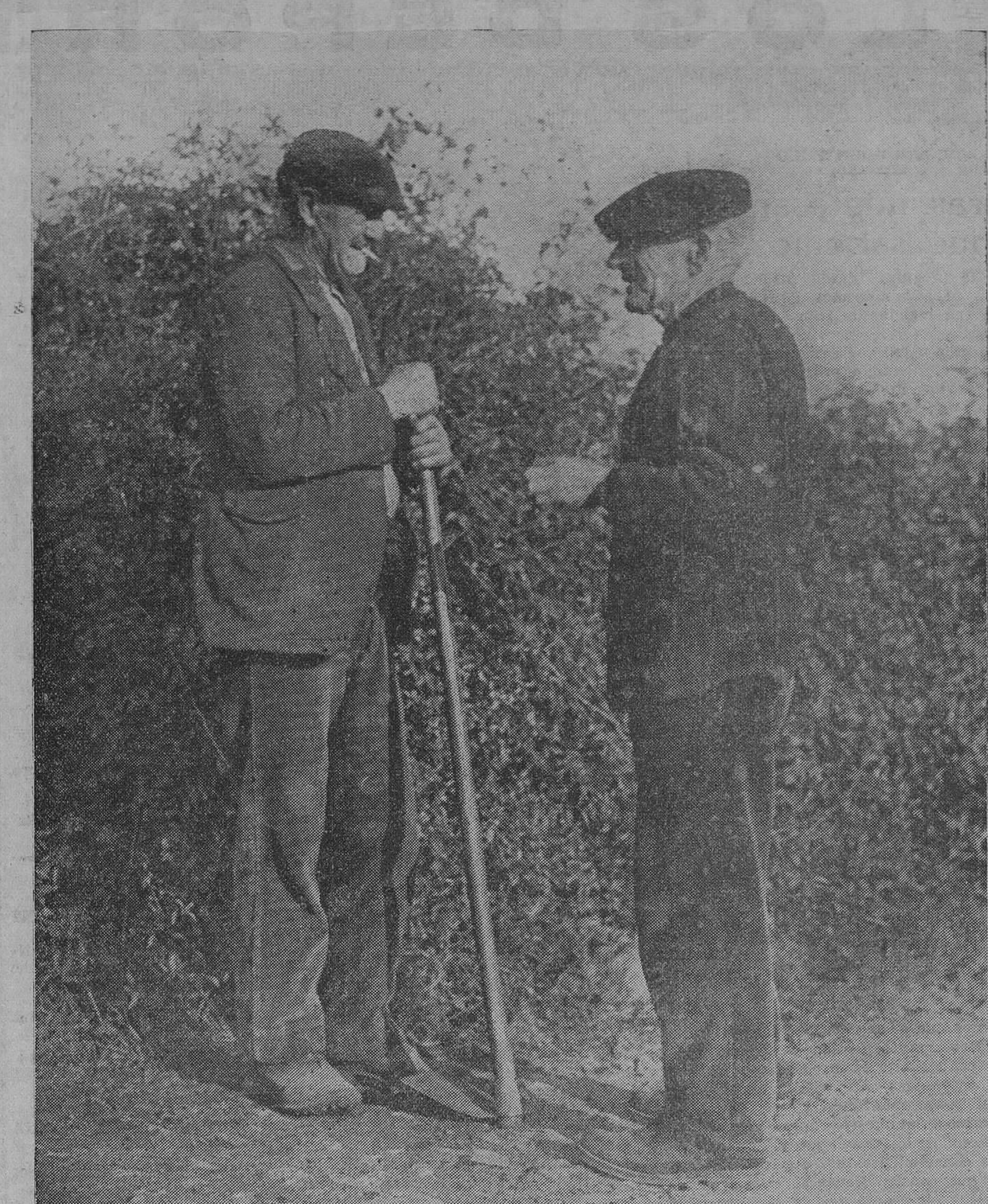
—¿Y qué te cuentas de la vida? Van ya los dos para muy viejos y todavía bajan al «praó» en cuanto apunta el día. La vida les ha castigado bastante, pero no han conocido las ambiciones ni los vicios de la ciudad, y esa pureza les conserva todavía con arreos para seguir trabajando. Así son todos los viejos de nuestra provincia. Sanos de cuerpo y de alma que se mueren de viejos como los barcos y los relojes de torre.

LA HAZAÑA DE POMBO Durante la tarde del martes la gente de nuestro pueblo aguardaba con visible impaciencia noticias del viaje aéreo del intrépido aviador montañés Juan Ignacio Pombo. La pregunta obligada era: ¿Qué se sabe de Pombo? Todas las radios de la localidad estaban alerta para recoger la fausta noticia de su arribo a Natal, y cuando a las cinco de la tarde se anunció el paso sobre la isla de Fernando Noroña, en todos los semblantes se reflejó el más alegre optimismo, y el comentario obligado era para enaltecer la valiente gesta del muchacho montañés, que, casi al asomarse a la vida, en lucha con los elementos y... ¡por qué no decirlo!—con la indiferencia de los eternos derrotistas, se lanzó a una empresa altamente pa-