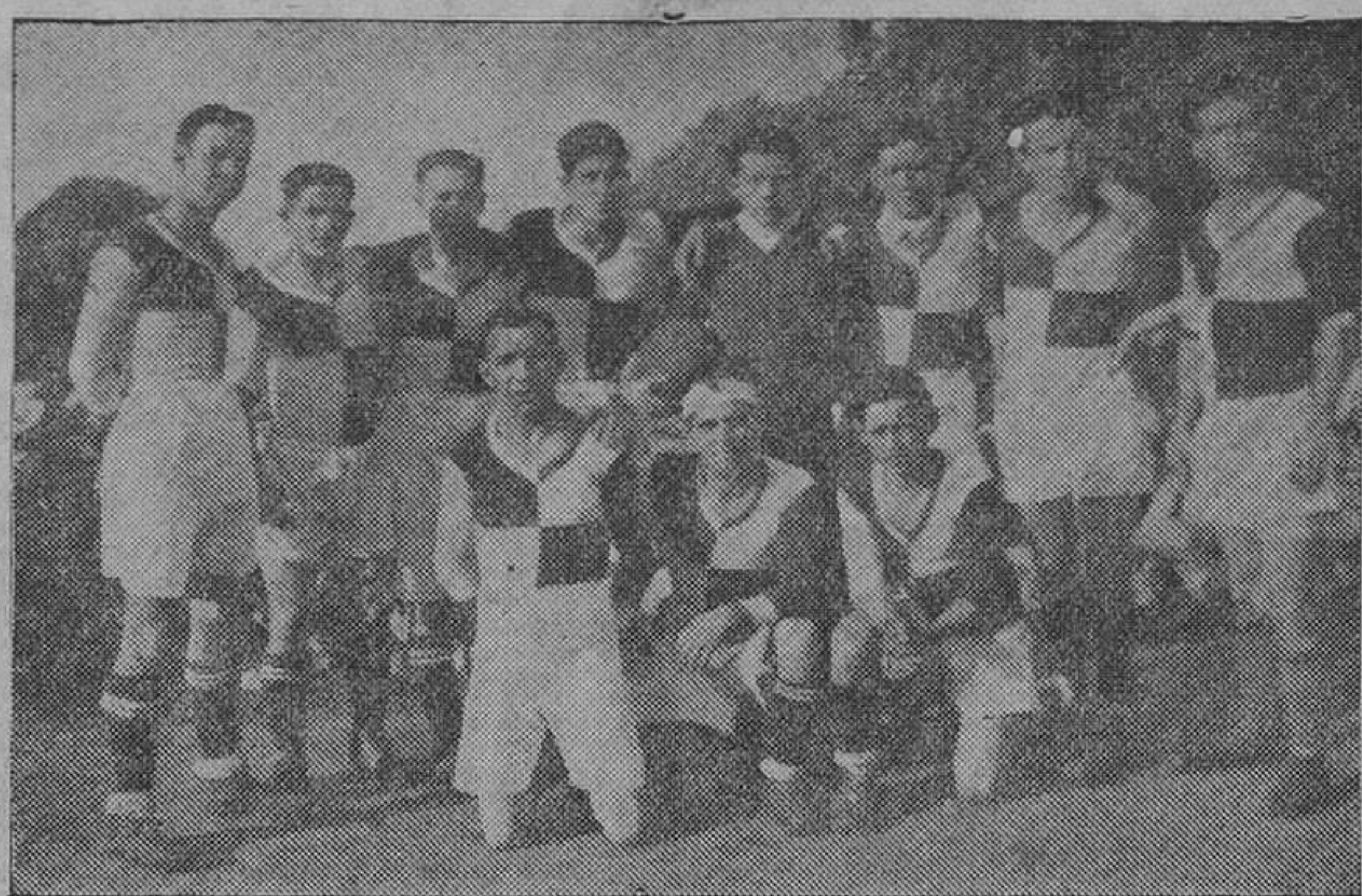
El club Deportivo San Román, de la serie A de la Federación de Clubs de Futbol Amateurs.

Con enorme interés son esperados los encuentros semifinales y finales que se darán este domingo. Los de mayor emoción serán, sin duda el Celta-N. Royal y Peñacastillo-Arenas, por depender el puesto de campeón y subcampeón serie B. Luego tenemos a la Cultural, de Guarnizo, club de gran historial en el deporte de Cantabria, frente al nota-