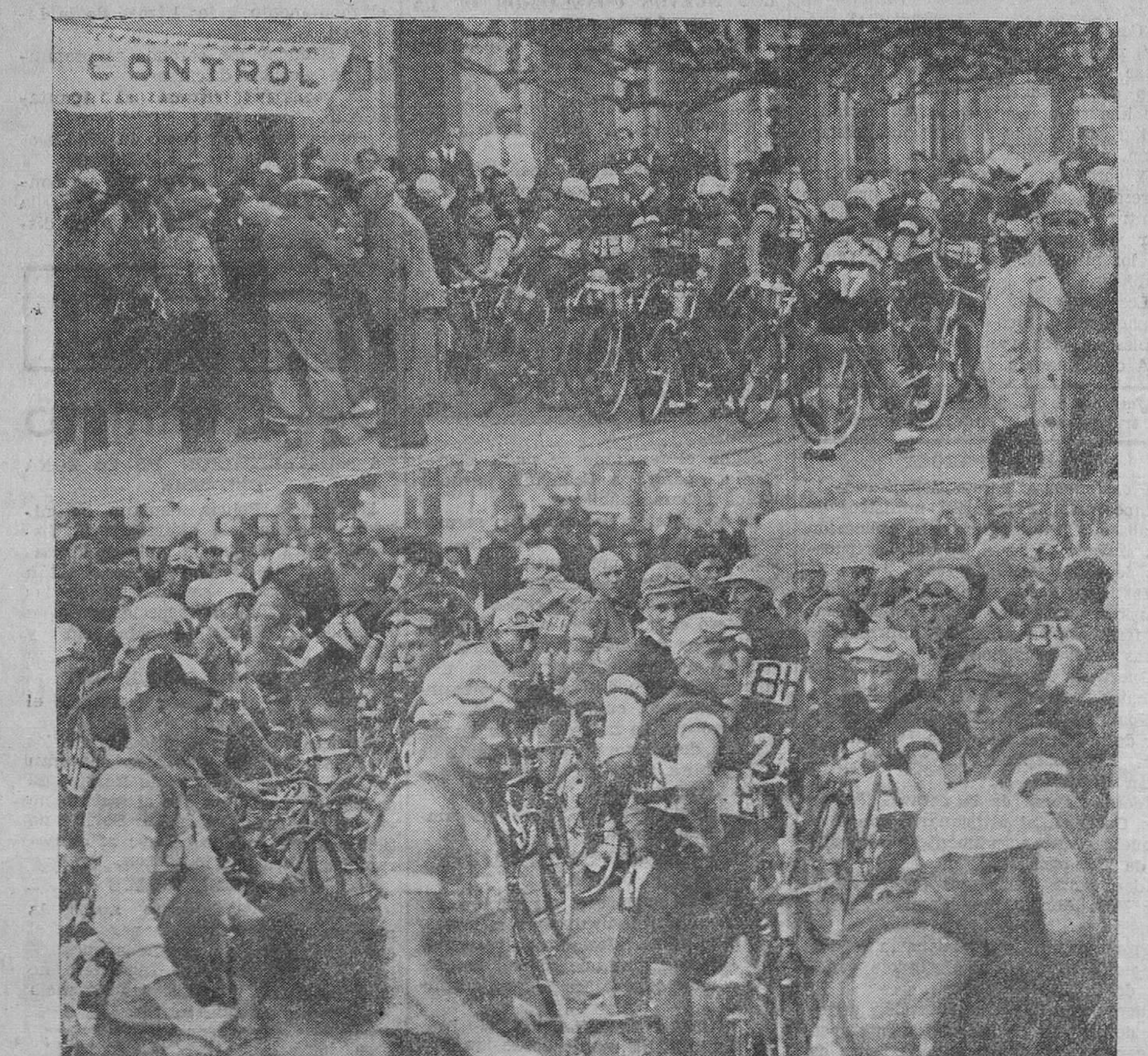
LA VUELTA CICLISTA A ESPAÑA. — Los corredores, en la madrugada de ayer, preparados para empezar la tercera etapa.

(Desde el 2 de mayo) Sedas, ropa interior, crespone, vestidos, colchas seda, sábanas, etc. - ARTICULOS DE GRAN CALIDAD. PRECIOS BARATISIMOS SOBERON Y PEROJO, Blanca, 16.