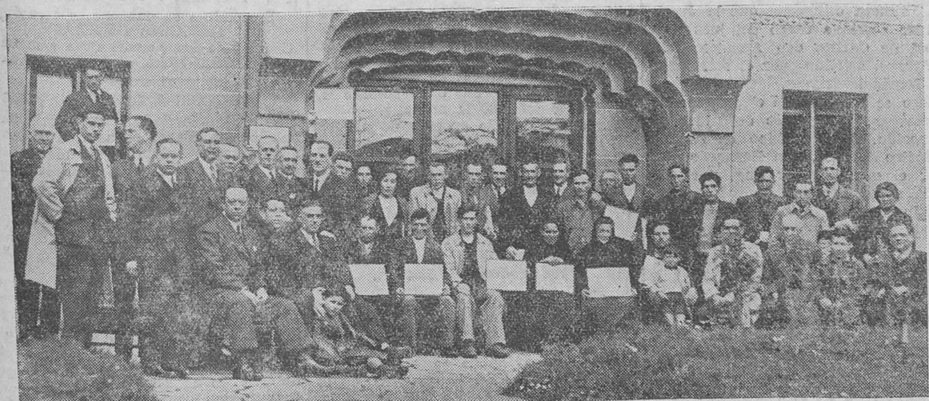
EN LA CAMARA DE LA PROPIEDAD. — El presidente y vocales de la Cámara, después del reparto de los diplomas y metálico a los pequeños propietarios de la provincia.

LA PRENSA YANQUI Nueva York.—«El New York Times»