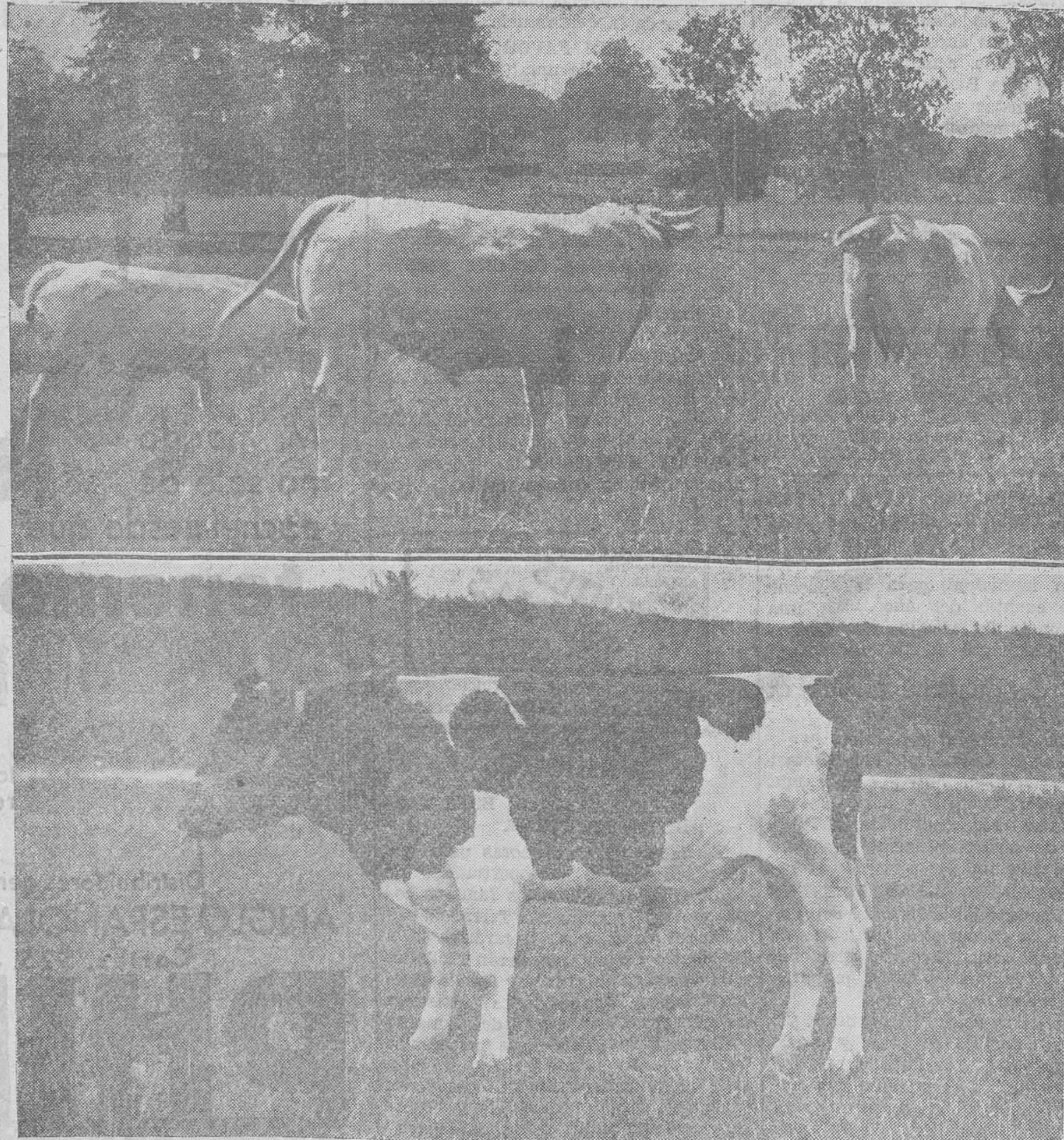
LA GANADERIA MONTAÑESA. — Vaca y novata en el pasto, y magnifico ejemplar de novillo Roanque, criando en la Montaña.

CENTRO FINANCIERO Cortes, 561, pral. derecha. Teléf. 35733 BARCELONA