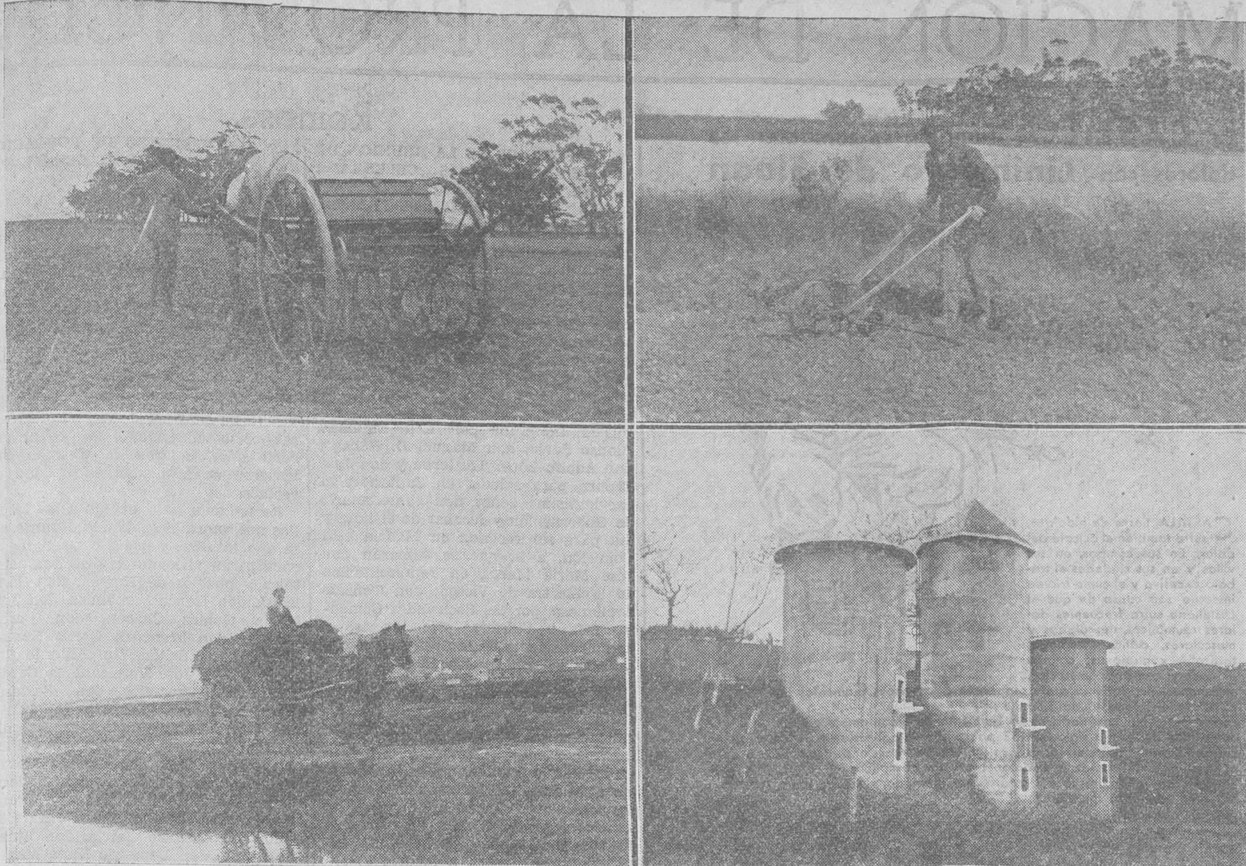
AGRICULTURA MONTAÑESA. — Sembradora mecánica. Pequeña sembradora muy útil para maíz, alubia, remolacha, etc. El «carruco de verde» a la llegada de la estación florida. Bateria de silos de hormigón armado.

...con un margen, claro está, para eventualidades, y esta ponderación, por ser muy pequeña, no basta para cubrir las necesidades para que se le requiere, y, por consiguiente, tampoco constituye una solución para los modestos campesinos.