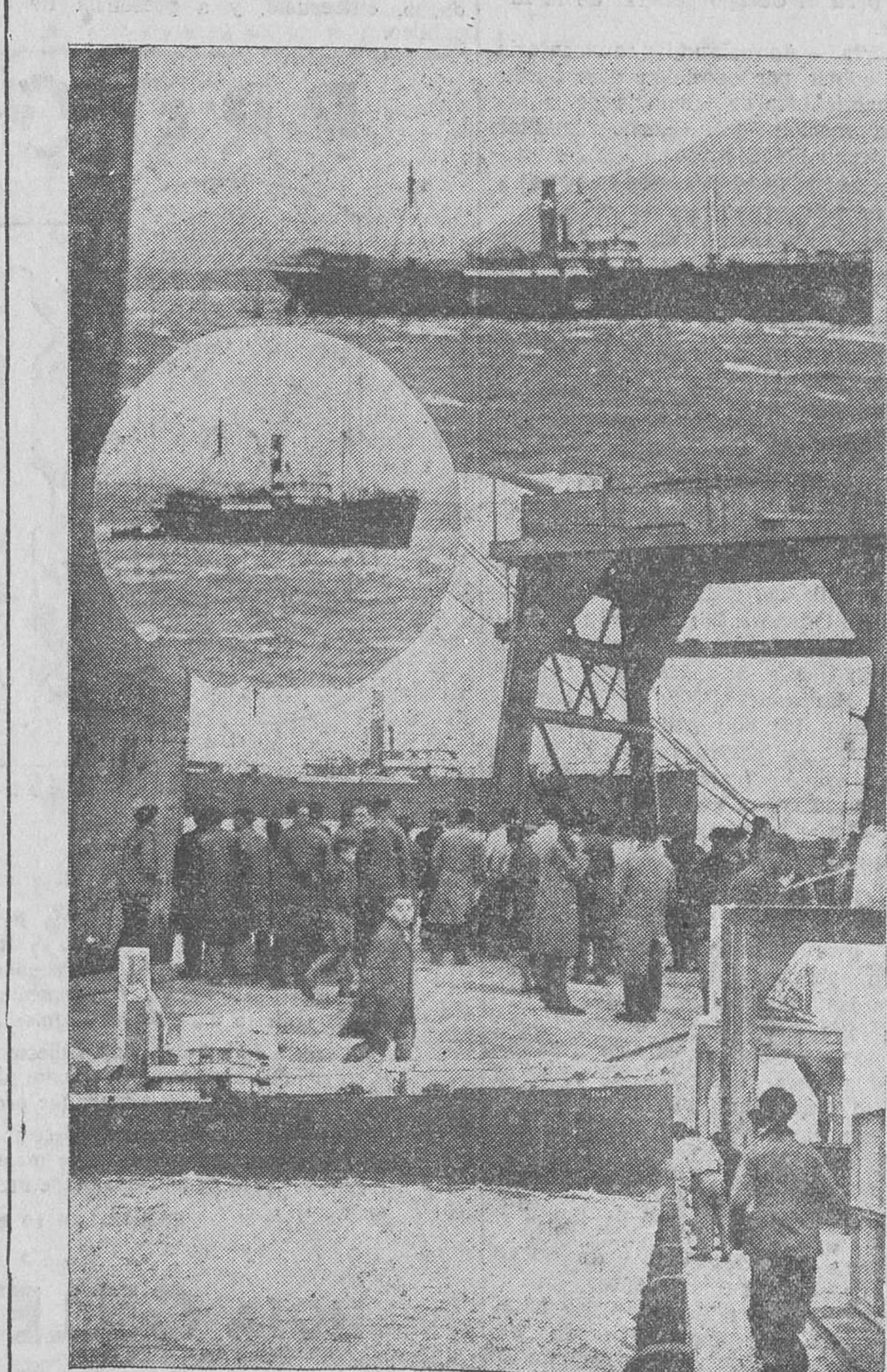
Varias notas del accidente ocurrido ayer al vapor «Esles», que a causa de haberle roto las cadenas de las anclas, se fué contra el nuevo muelle, próximo al Depósito franco. En la foto inferior de la composición que exponemos a nuestros lectores, puede apreciarse el modo de «atacar» al muelle por la proa del «Esles».

Para el Eclipse la victoria de este partido le interesa grandemente, porque si pretende aspirar al título de campeón, y con ello poder enfrentarse al campeón de Castilla-Aragón, es necesario que no se deje arrebatar ningún punto en su camino.