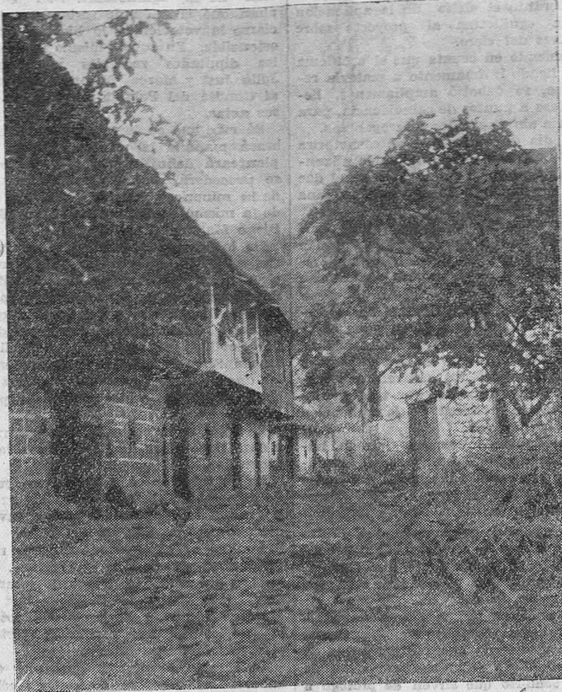
Un paisaje de Barcena de Carriedo, típicamente montañoso.