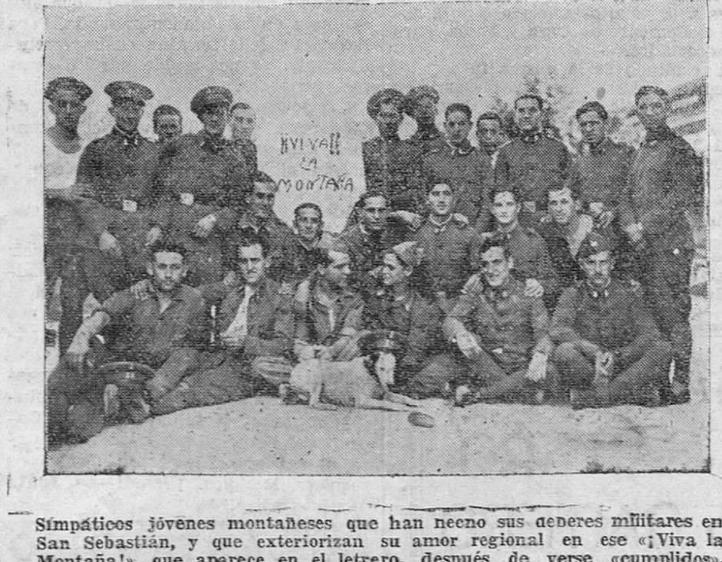
Simpáticos jóvenes montañeses que han hecho sus deberes militares en San Sebastián, y que exteriorizan su amor regional en ese «Viva la Montaña!», que aparece en el letrero, después de verse «cumplidos».