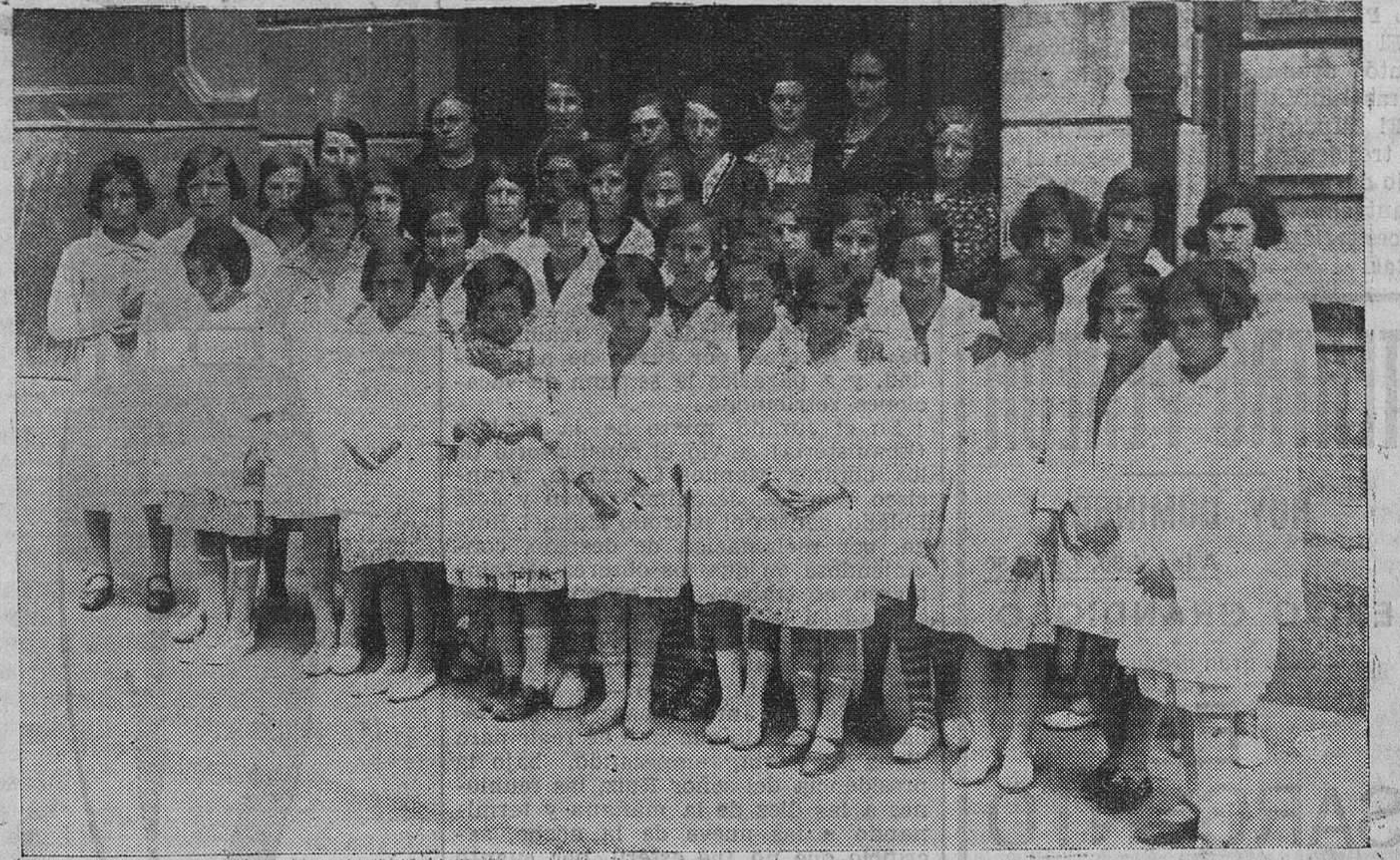
VISITA ESCOLAR. — Ayer, por la mañana, recibimos la grata visita de varios niños pertenecientes al barrio de Valbanuz, en el pintoresco pueblo de Selaya. Acompañando a los pequeños venía la inteligente y distinguida maestra que regenta dicha escuela. Después de visitar EL CANTABRICO, los niños pasaron recorriendo diferentes lugares de la población, mostrándose satisfechísimos de su viaje, que la mayor parte de ellos habían hecho por primera vez. Fue una lástima que el mal tiempo desluciera la excursión, que hubiera resultado preciosa en otro caso.

Para tan necesarias órdenes, que entran de lleno en las atribuciones del gobernador civil, no se necesita del