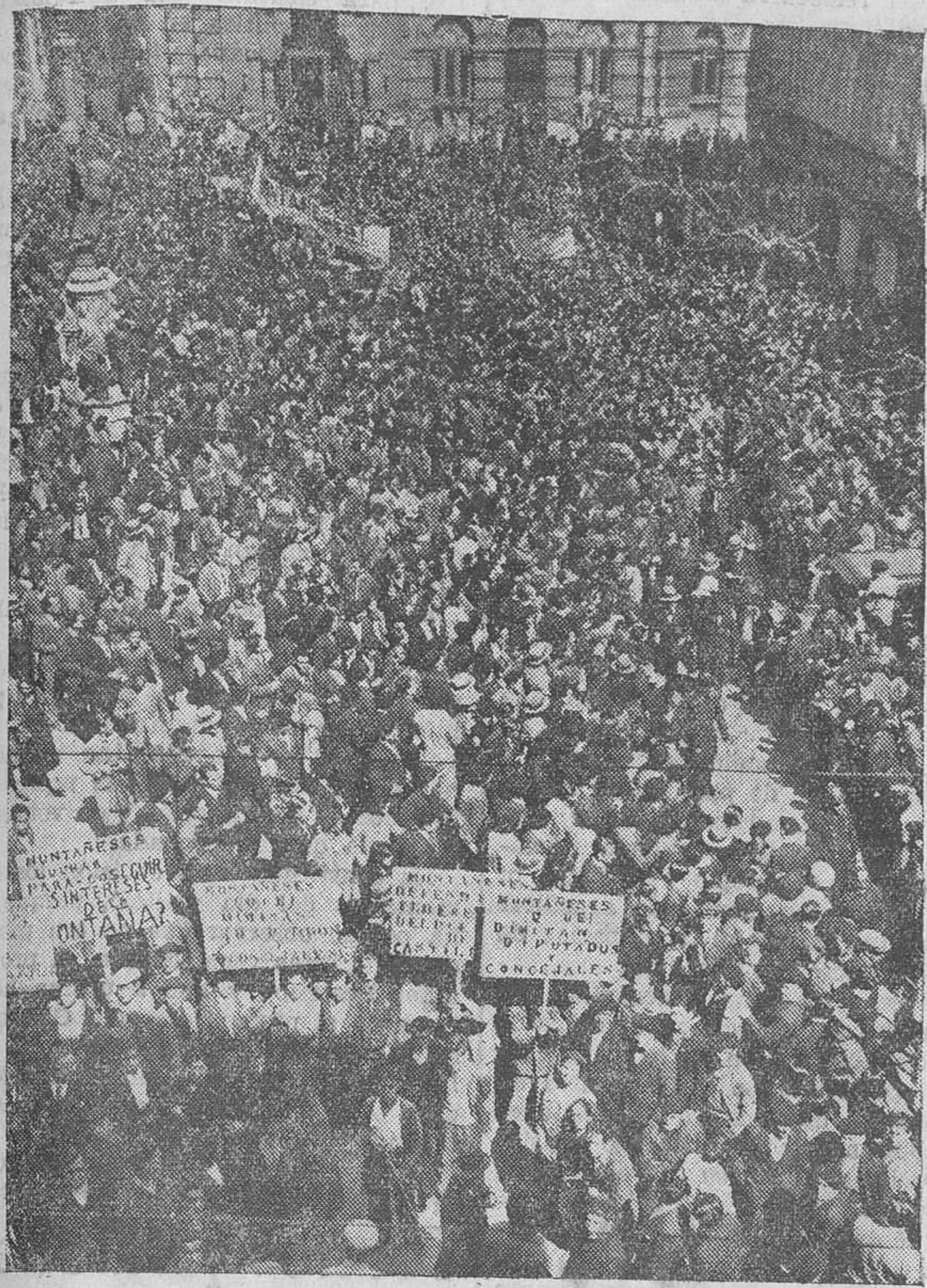
LA MANIFESTACION DE AYER. — Antes de sonar las doce, ya se hacía imposible el paso por la plaza de Pi y Margall.