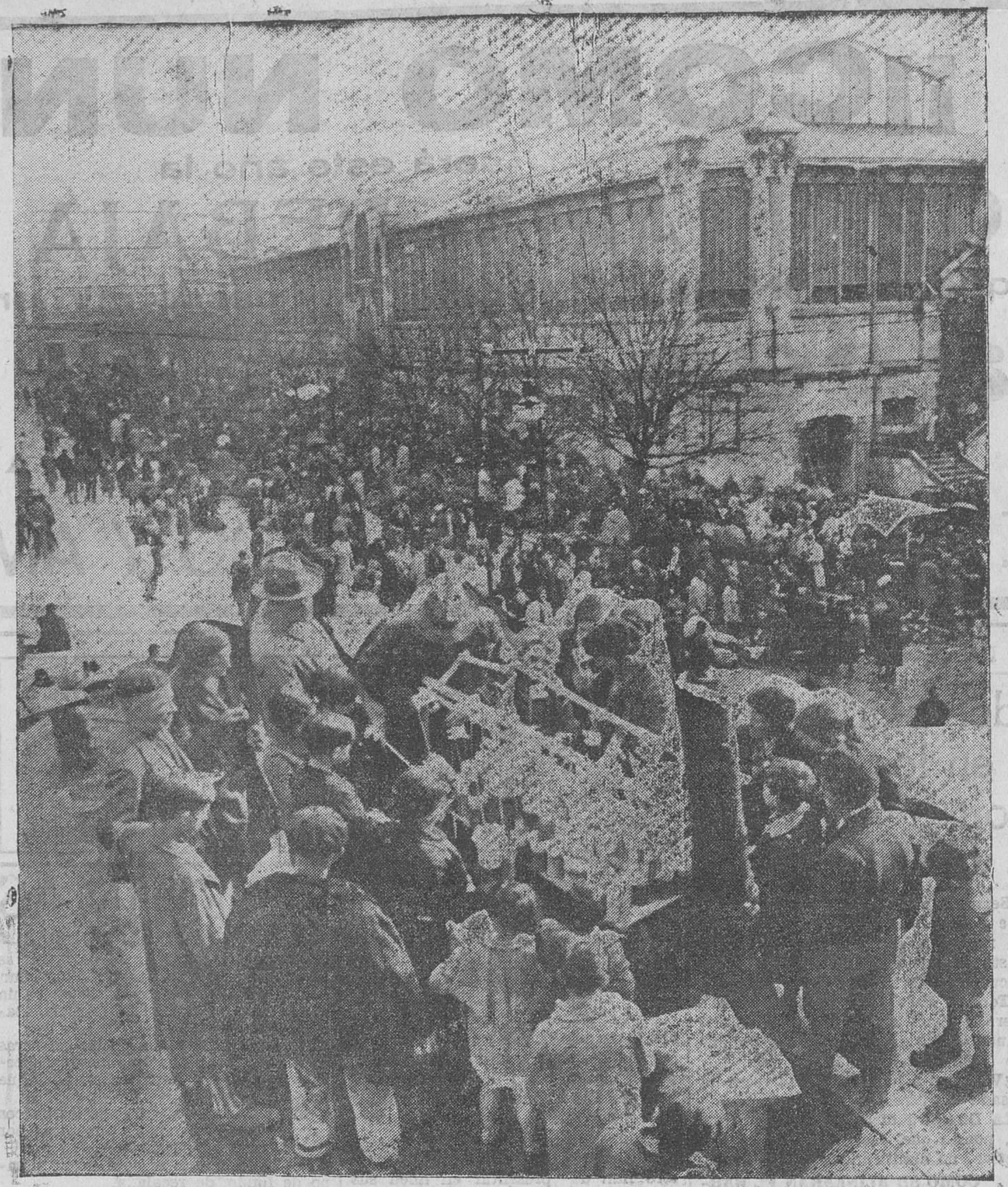
LOS MERCADOS EN ESTOS DIAS. — Es posible, seguro, por desgracia, que no todos los españoles pueden comer como ellos desearan en estos días de Año Viejo. Pero vean ustedes el aspecto de uno de los mercados de la ciudad en la mañana de ayer, y convendrán con nosotros en que el enorme estómago de la ciudad se ha quedado anoche con ganas.

Es ya vieja costumbre que estos mercados que coinciden en fechas con las fiestas hogareñas se vean muy concurridos; así, el mercado último de año, celebrado ayer al exterior de la plaza de la Esperanza, fué visitadísimo por compradores y vendedores. No se hacen estadísticas de ventas; pero las de ayer—a pesar de que los recursos han sido muy mermados por las fiestas de Navidad—fueron, sin duda, muchas y muy cuantiosas. El aspecto general del mercado fué muy animado, acudiendo vendedores de frutas, hortalizas, aves y otros productos, de diferentes pueblos de la provincia. Lo que no nos explicamos es que el Ayuntamiento, que tiene un ingreso muy saneado de estos mercados al exterior—no menor de seiscientos pesetas semanales—, no se preocupe de estudiar la mejor manera de que puedan celebrarse incluso los días más lluviosos del invierno, construyendo una marquesina lo suficientemente amplia para que bajo ella puedan refugiarse del mal tiempo vendedoras y compradoras.