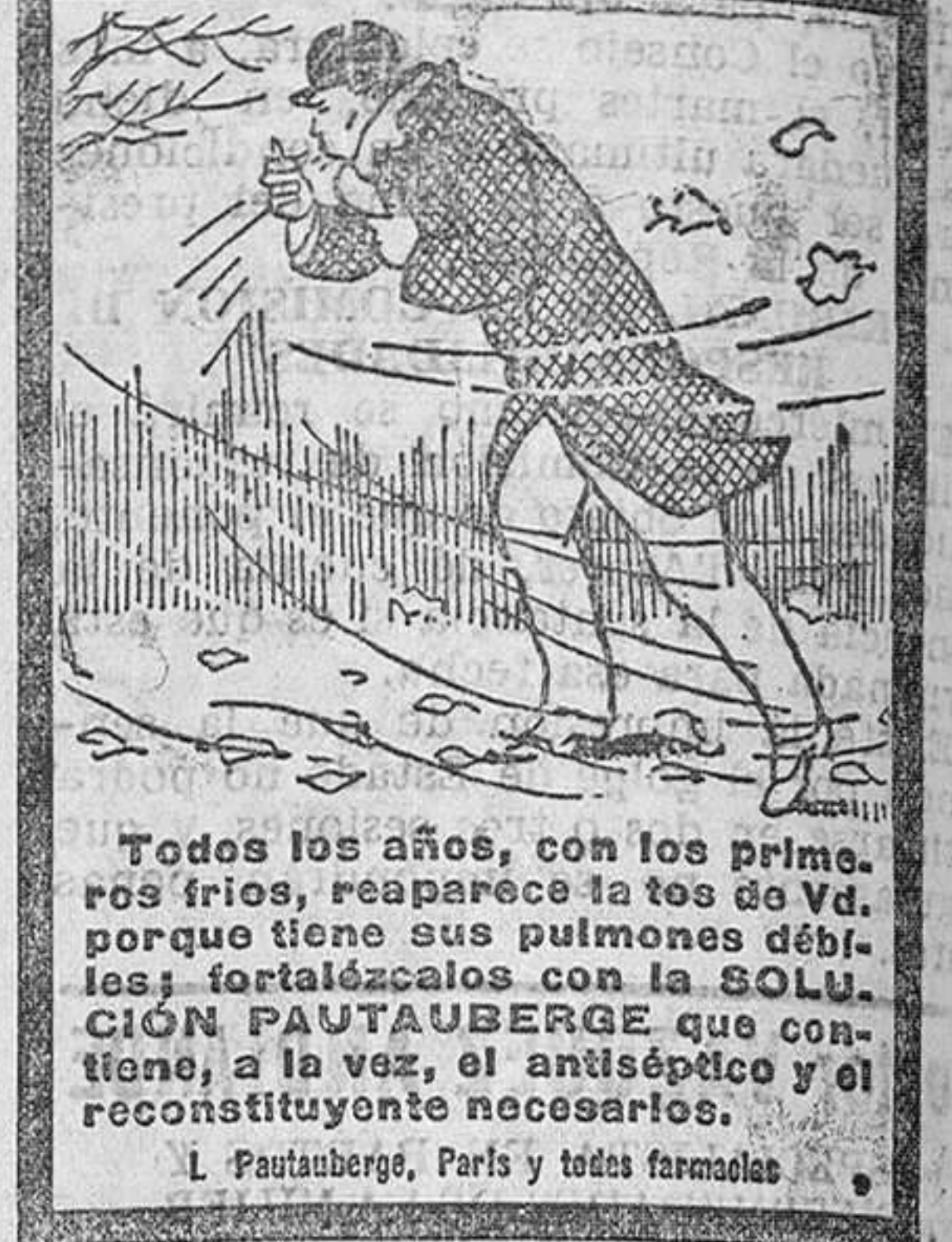
Todos los años, con los primeros fríos, reaparece la tos de Vals, porque tiene sus pulmones débiles; fortalezclos con la SOLUCION PAUTAUBERGE que contiene, a la vez, el antitélico y el reconstituyente necesarios. L. Pautauberge, París y todas farmacias.

Wad-Ras, 3. Teléfono 1043. Blanca, 17 (Droguería Azul). Teléf. 2013. Compañía, 3. Teléfono 3800.