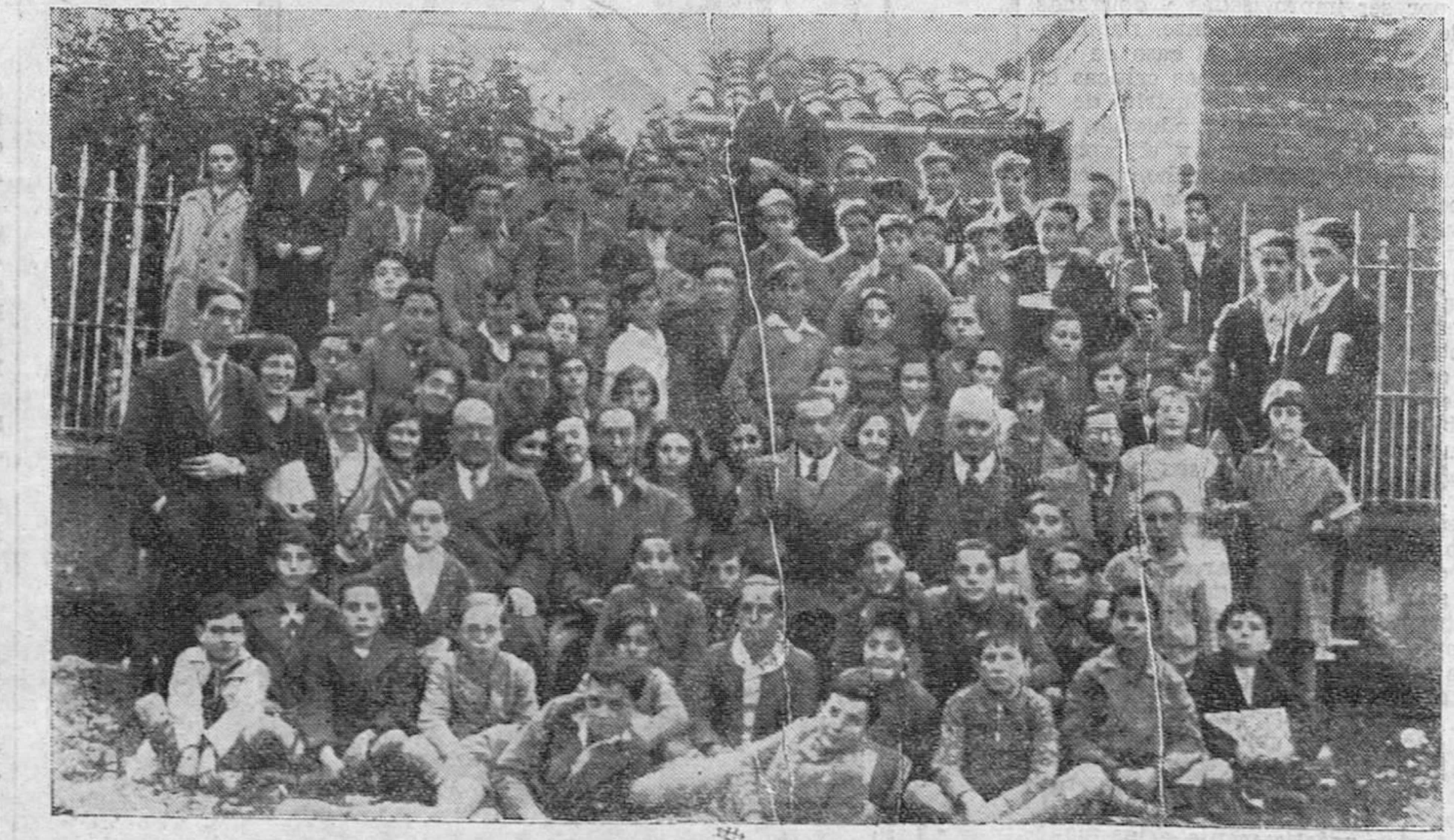
REINOSA. -- Profesores y alumnos del Colegio de Segunda Enseñanza, en la inauguración del edificio.