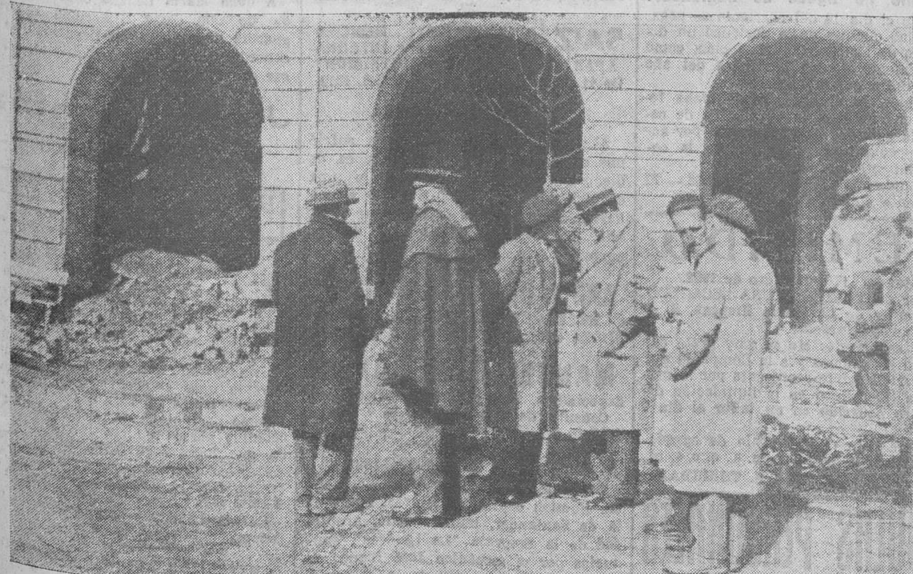
EL INCENDIO DEL AYUNTAMIENTO DE REINOSA. — El gobernador civil de la provincia, señor Díaz Quiñones, visitando en la mañana de ayer las ruinas de lo que fueron oficinas, salón de sesiones y Biblioteca municipal y juzgado de instrucción.

La misa de alma se dirá hoy, a las ocho, en la parroquia de San Francisco.