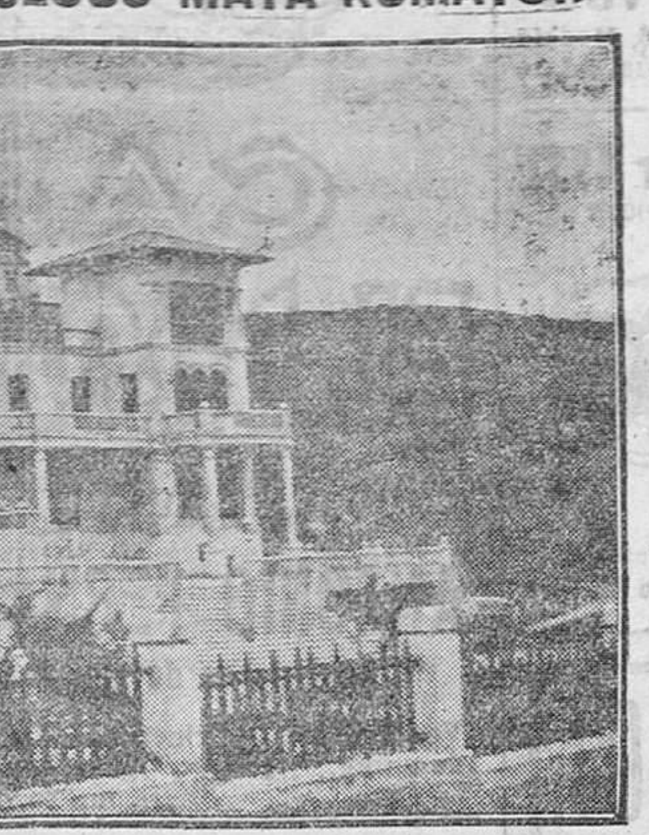
Este Sanatorio está principalmente destinado a las enfermedades de los huesos, músculos y articulaciones en sus afecciones tuberculosas, siendo de inmejorables resultados en los estados pre-tuberculosos, enfermedades de la nutrición, raquitismo, etc., etc. Su bella situación, hermosa instalación y confort le hacen ser uno de los mejores de España.