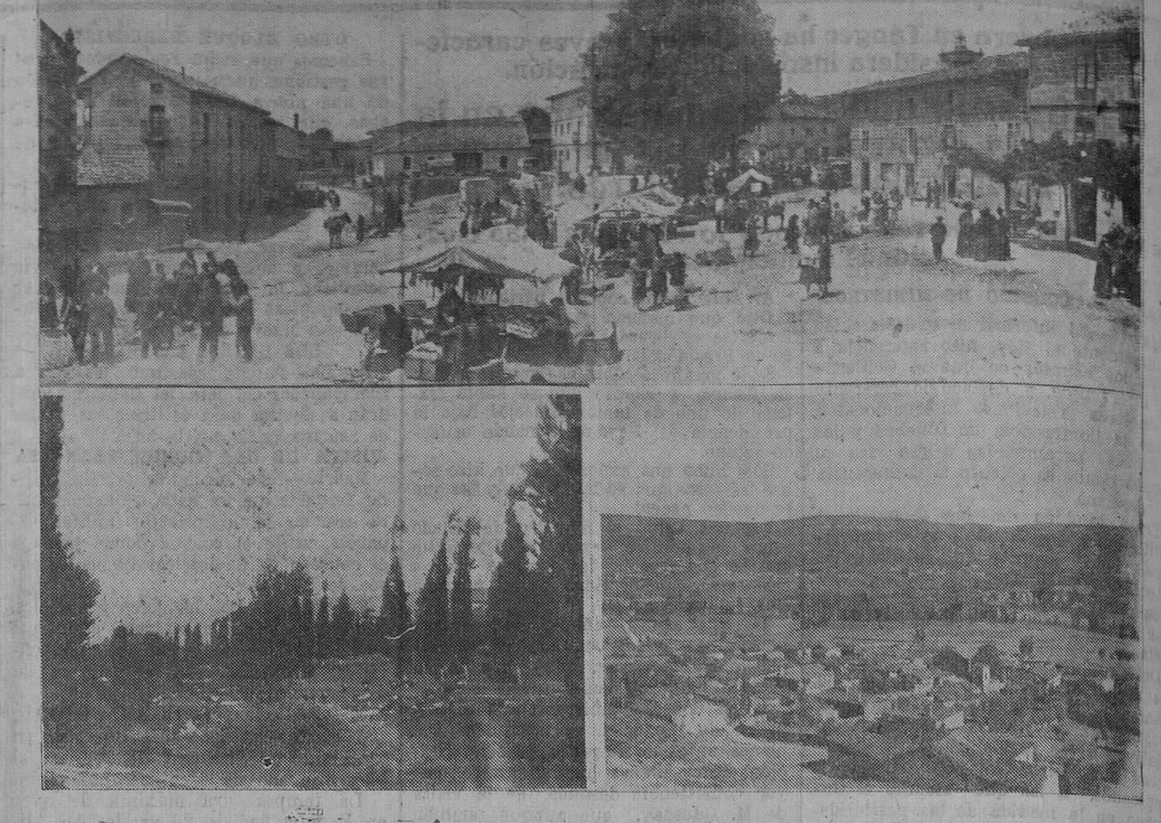
PÓLIENTES. — La plaza de la olma en un día de mercado ofrece un aspecto pintoresco. — Un bello paisaje junto al Ebro. — Vista general de la villa, capital de Valderredible.

VIDA SOCIETARIA Casa del Pueblo. SOCIEDAD DE CERVECEROS "LA UNION" Esta Sociedad celebrará junta general hoy, viernes, a las cinco y media de la tarde.