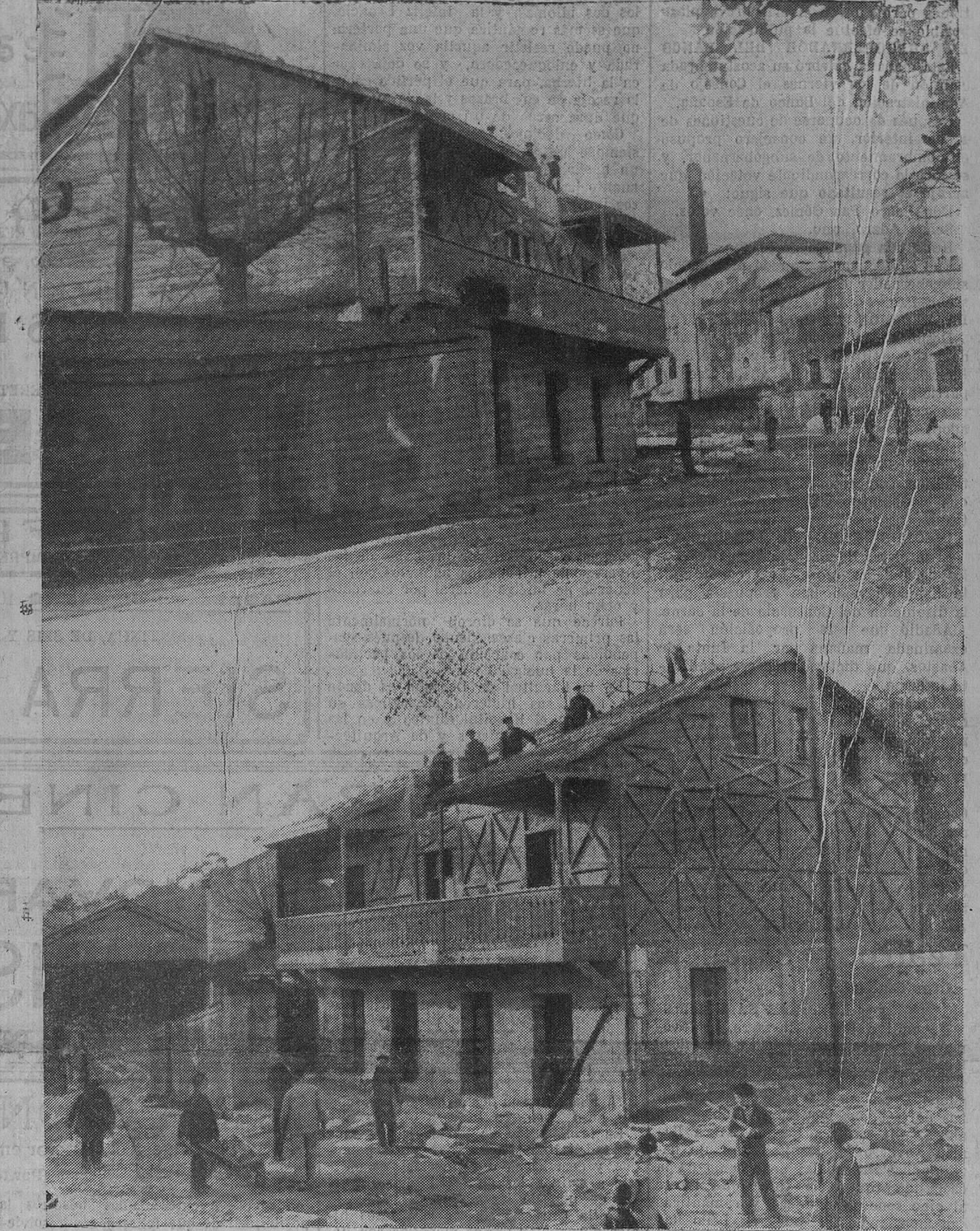
EL EMBELLECIMIENTO DE UNA DE LAS ENTRADAS DE SANTANDER.—La vieja casa de "Austriaca", cuyo derribo ha comenzado ya, y que permitirá la continuación de las obras de ampliación de una de las más bellas entradas a la ciudad.

—Sí—nos contestó—. Yo digo, porque puedo decirlo, que Su Majestad el Rey tiene de par en par las puertas de su cámara para todo aquel que quiera exponerle un juicio o una opinión sobre el momento presente. Afirmando también que el Soberano agradecerá el consejo o la advertencia, porque jamás los ha rehusado. Ahora bien; cuando el Gobierno intenta desplazar de las organizacio-