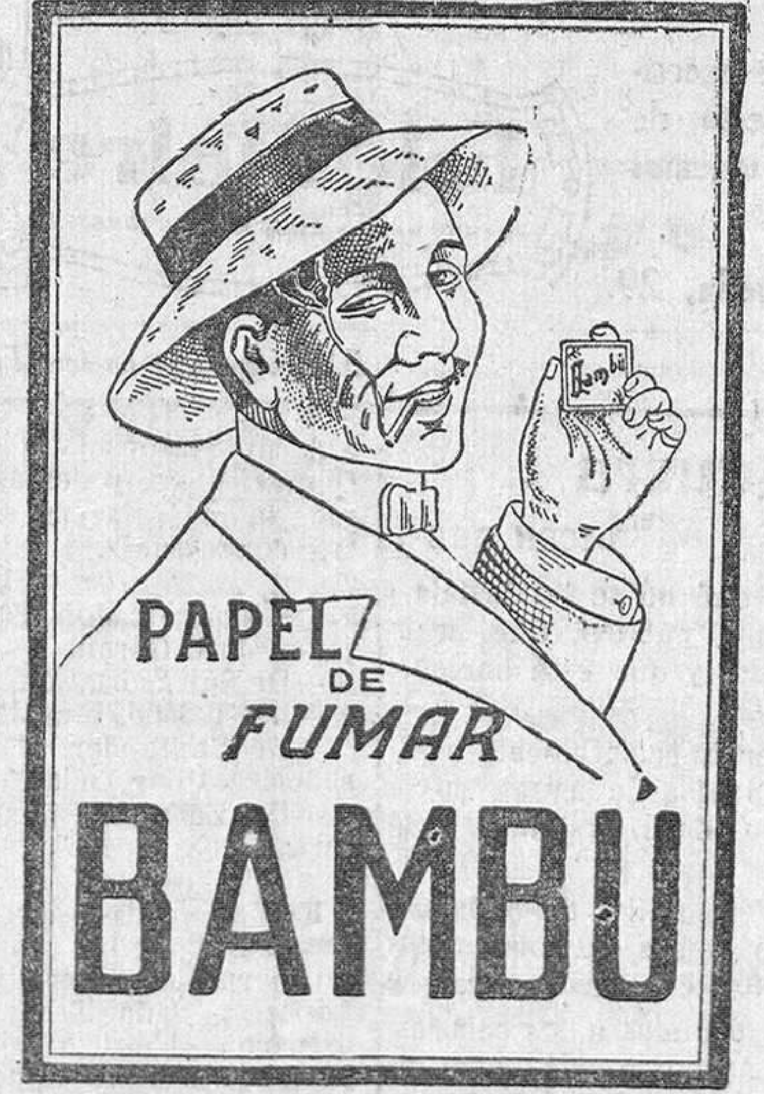
Ha obtenido GRAN PREMIO en la Exposición de Barcelona de 1929

GALLEAS La galleta nutritiva y sabrosa. Rica en vitaminas, generadora de calorías. Paquete de 200 gramos: una peseta.