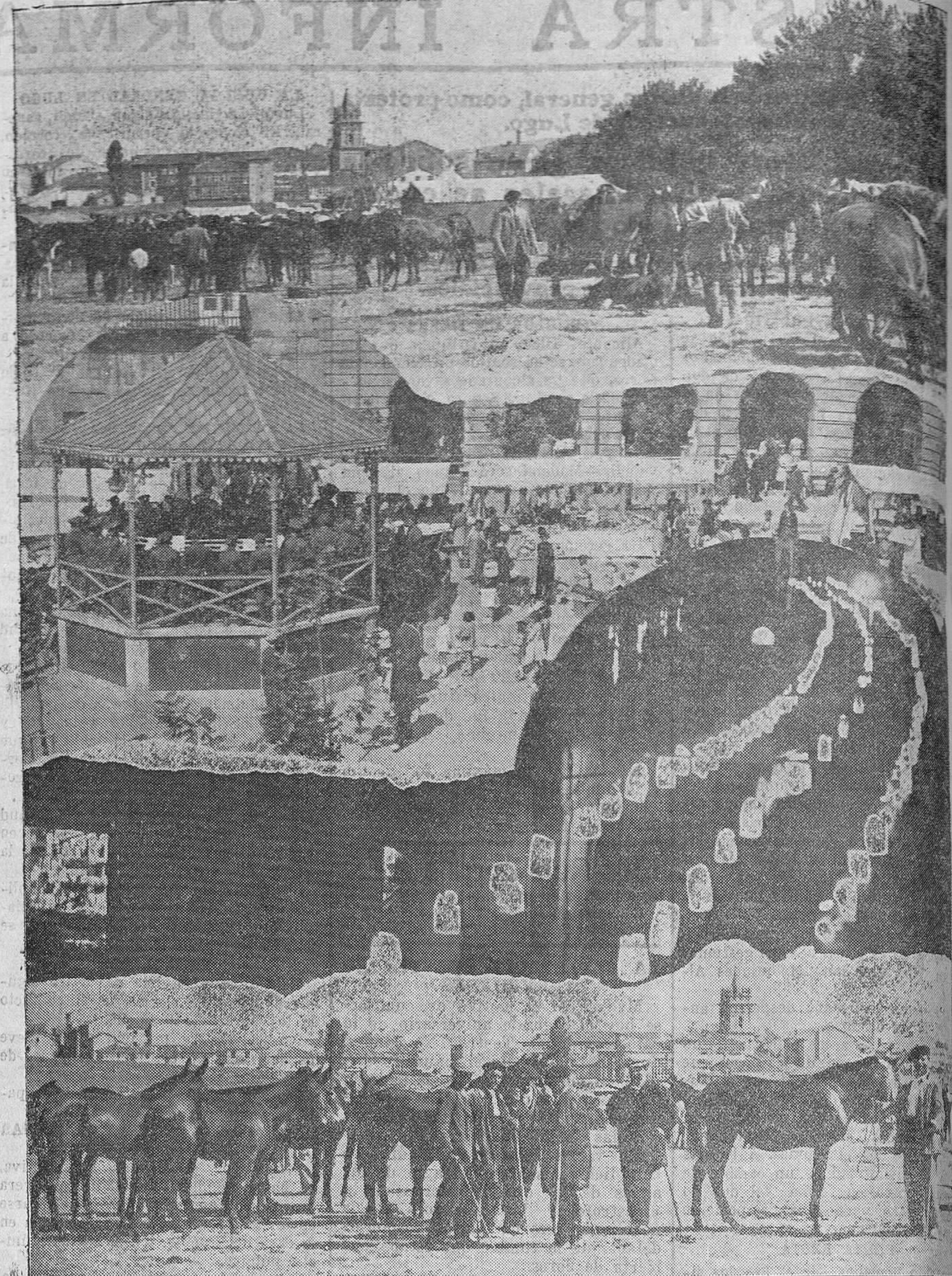
REINOSA. — Feria de ganado, conciertos, iluminaciones... De todo tienen este año las brillantes fiestas en la ciudad campurriana.

Merced a la gestión del ministro de Fomento, ese paseo pasa a depender de Obras Públicas, que suponemos se apresurará a pavimentarle en las debidas condiciones para que podamos mostrar a cuantos nos visiten uno de los paseos de pintura más bonitos de España, y que ahora tenemos sumo cuidado en ocultar por su estado miserable. Como se sabe, el paseo del Alta corresponde al trayecto comprendido entre el Abastecimiento de Aguas y Miranda; pero, por virtud del acuerdo del Consejo de ministros, pasa a depender también de Obras Públicas la parte correspondiente a la avenida de los Infantes, hasta la casa que en los pinares ocupó hace años el infante don Carlos.