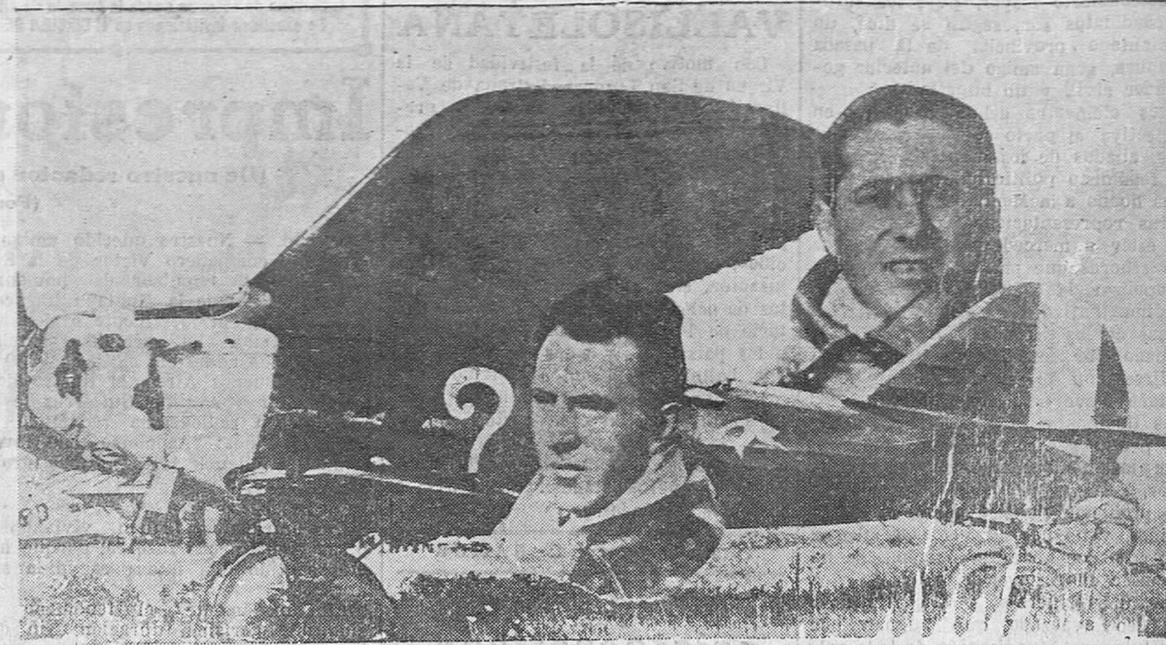
El famoso avión "1", con el que los notables aviadores Costes y Bellonte han realizado la proeza de volar París-Nueva York, en magnífico vuelo.

Abarca esta obra, con la ampliación, por el Este, hasta la capilla de San Roque, y por el Oeste, hasta la casa real; la construcción de varias terrazas con piscinas de natación para ni-