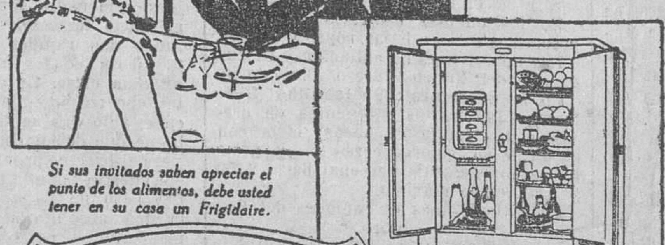
Frigidaire EL REFRIGERADOR AUTOMÁTICO SILENCIOSO

AL agasajar a sus invitados debe procurarse que el servicio de su mesa sea perfecto, y para ofrecer todo a punto —cremas heladas, sandwiches frescos, ensaladas crujientes o vinos a la temperatura justa— es imprescindible poseer un Frigidaire.