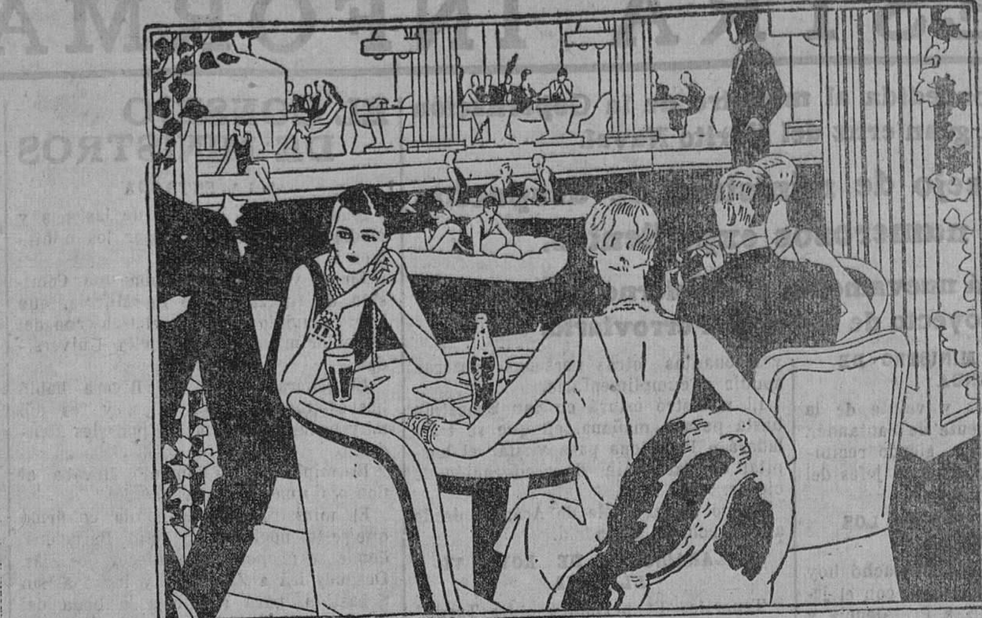
Saborear un vaso de Coca-Cola es un detalle del que no saben prescindir los paladares refinados

EL "LOIRE" Es esperado en este puerto en los primeros días de la próxima semana, procedente de Amberes, con unas mil toneladas de carga general para el comercio de esta plaza.