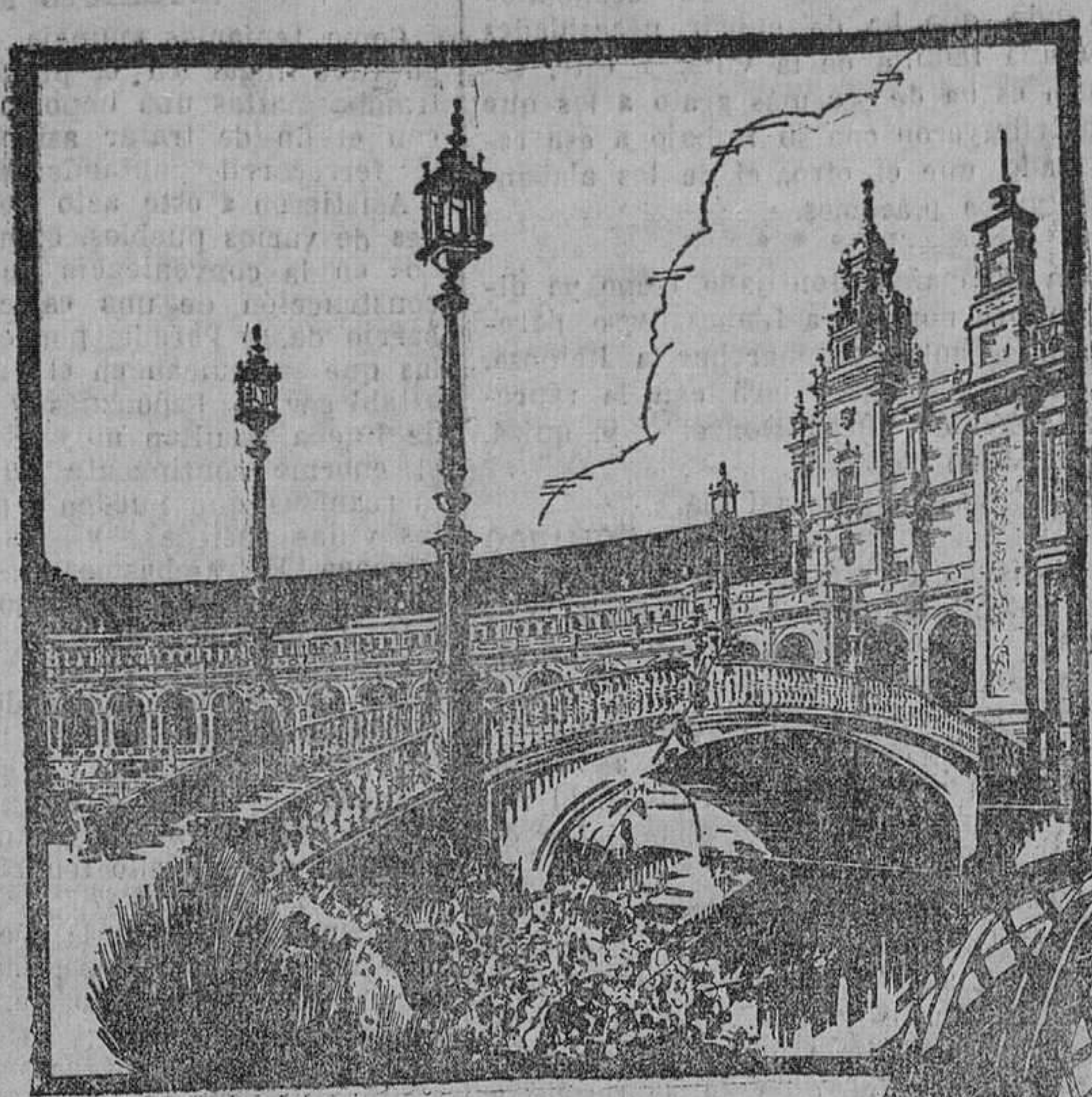
Exposición de Sevilla Plaza España

DODGE BROTHERS' MOTOR CARS, DIVISION OF CHRYSLER MOTORS, DETROIT, MICHIGAN