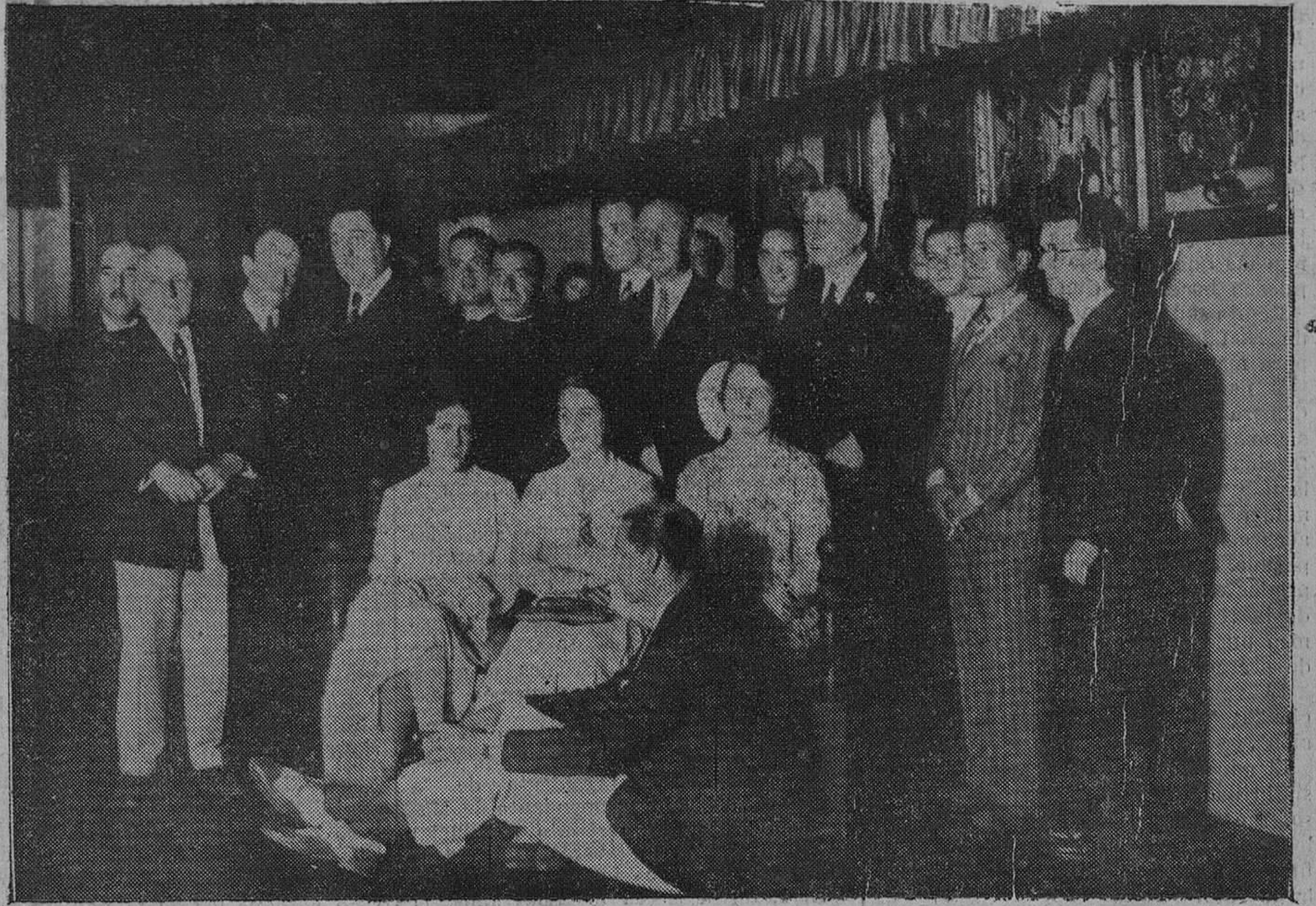
SANTILLANA. — La archiduquesa Margarita y el conde de Güell, con las autoridades y artistas, en el acto inaugural de la Exposición de pintores y escultores castellanos.

Terminada la comida, los comensales se trasladaron a la casa de la archiduquesa, en cuya planta baja y primer piso se hallaba la Exposición. Bendijo el local el señor Escagedo Salmón, pá-