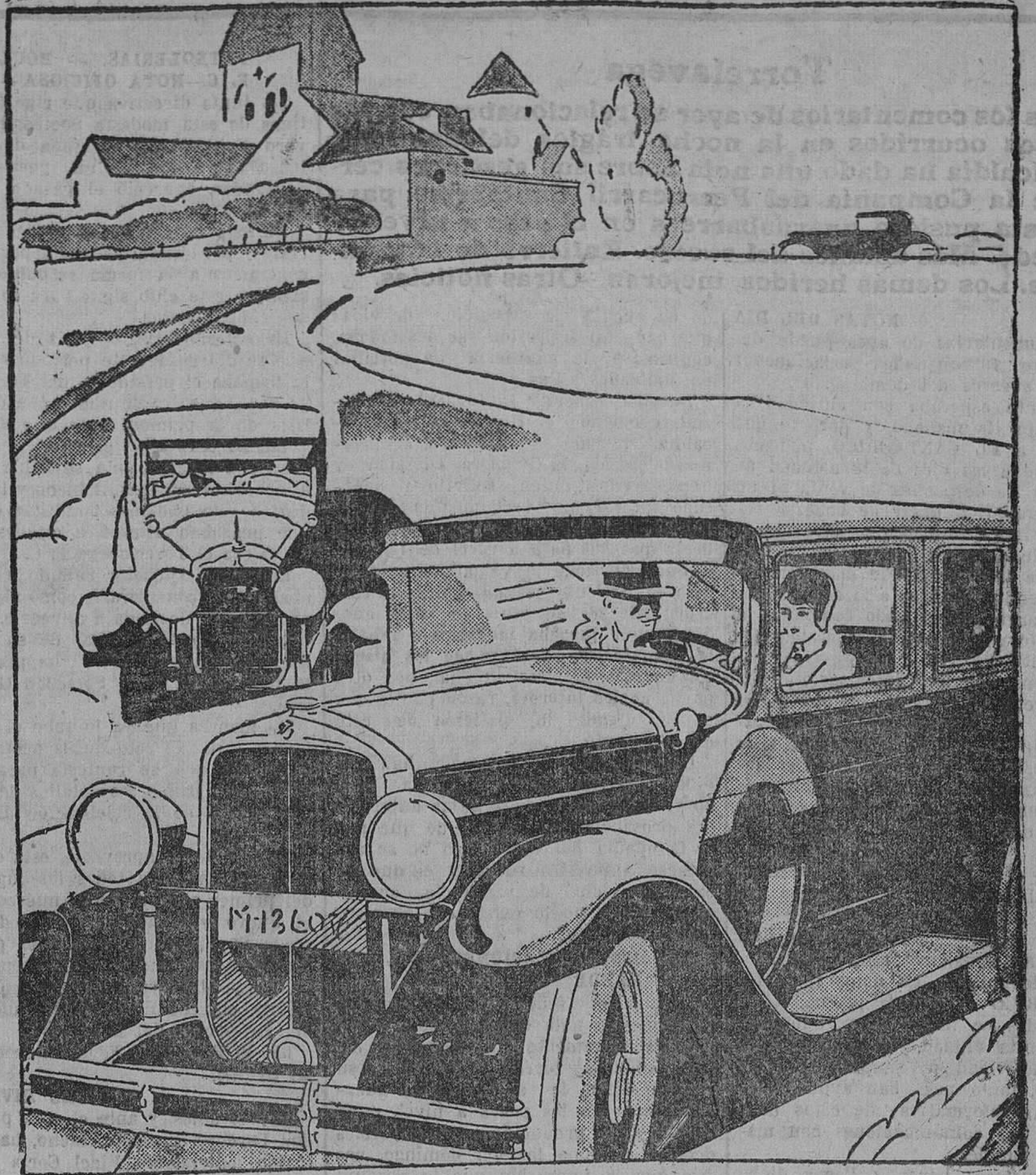
La distinción y el trazado moderno de sus líneas hacen destacar la individualidad del Marquette

—¡Bien vengas, mal, si vienes solo!... Anoche, momentos después de ocurrir la tragedia del segundo pájaro amarillo, cayó un rayo en Ramera, pueblo del Ayuntamiento de Polanco, y mató a una mujer y a una niña, hija de la infortunada vecina. Al padre de la criatura también le alcanzó el rayo, pero no le mató, afortunadamente... ¡Dígame usted si esto es vida!... —Nosotros seguiremos previendo catástrofes... Los señores graves, o no nos harán caso o dirán que somos unas cornejas, unas aves agoreras de tres al cuarto. Si no vuelven a funcionar las portillas en el paso a nivel de Barredal la Prondosa, volverá a ocurrir otro suceso trágico. Si él le costase la vida a un ilustre personaje, de