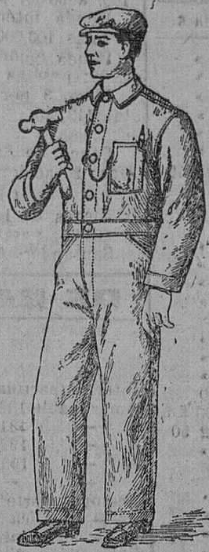
Precio: 18 pesetas.

Deben llevarlos todos los mecánicos, carpinteros y obreros en general, por ser el traje mejor para trabajo.