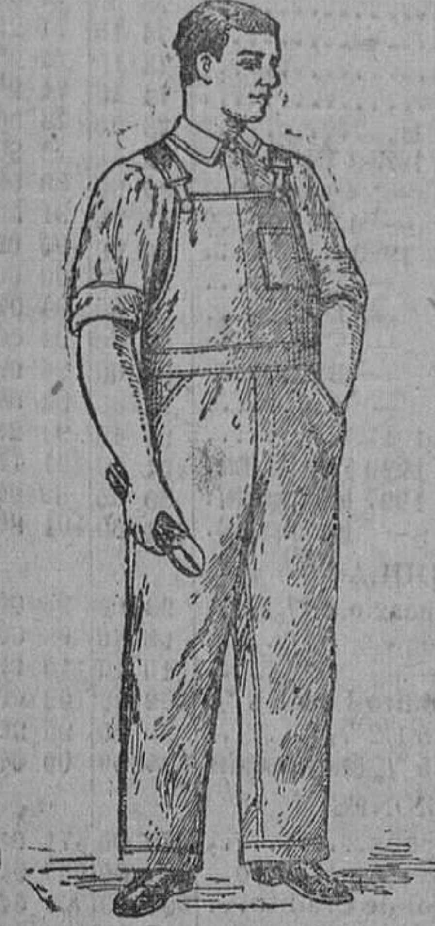
Precio: 12'00 pesetas.

Los más prácticos. Los más económicos, por ser su duración cuatro veces mayor que cualquier otro.