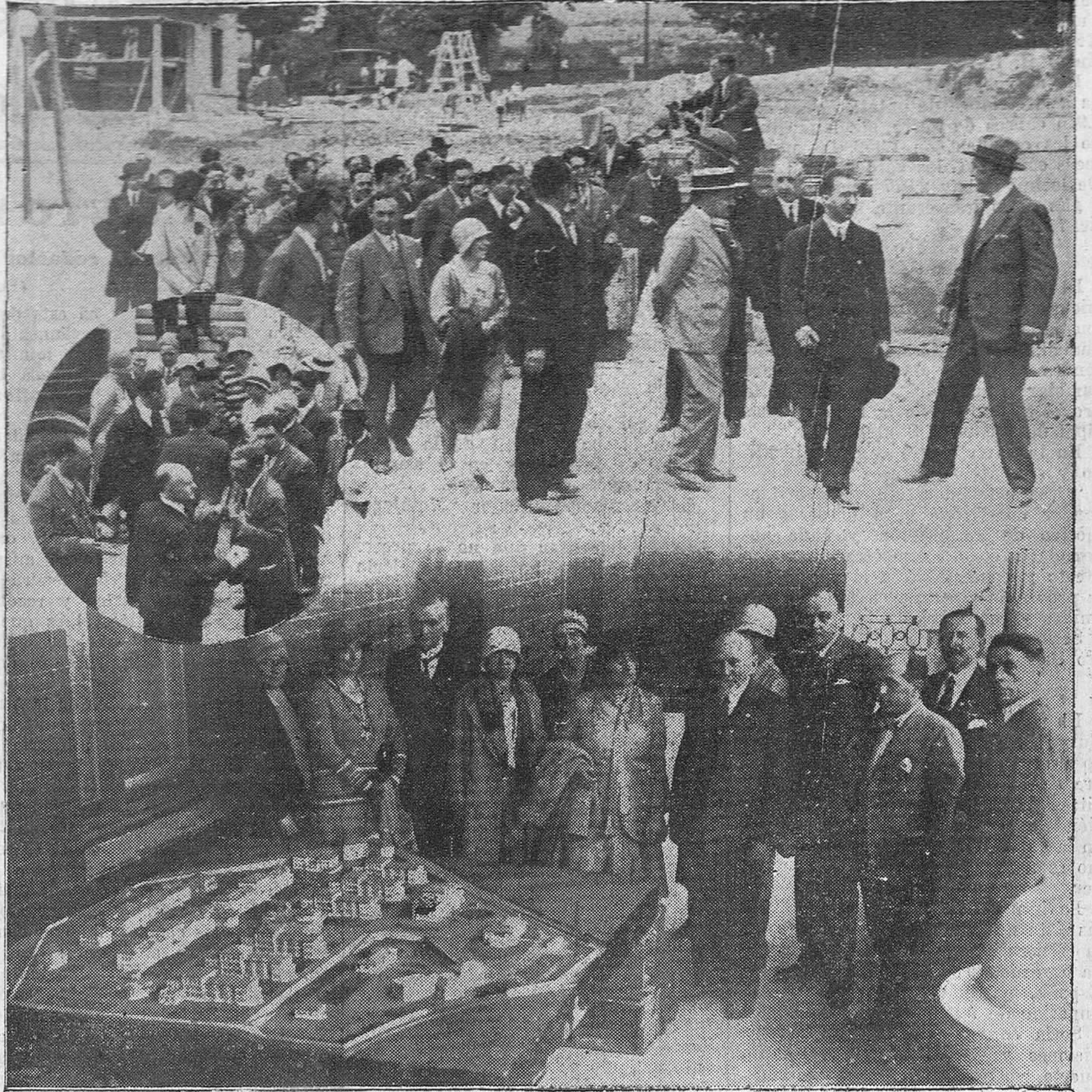
Los excursionistas de estudios médicos, en su visita a las obras de la Casa de Salud Valdecilla, efectuada ayer.