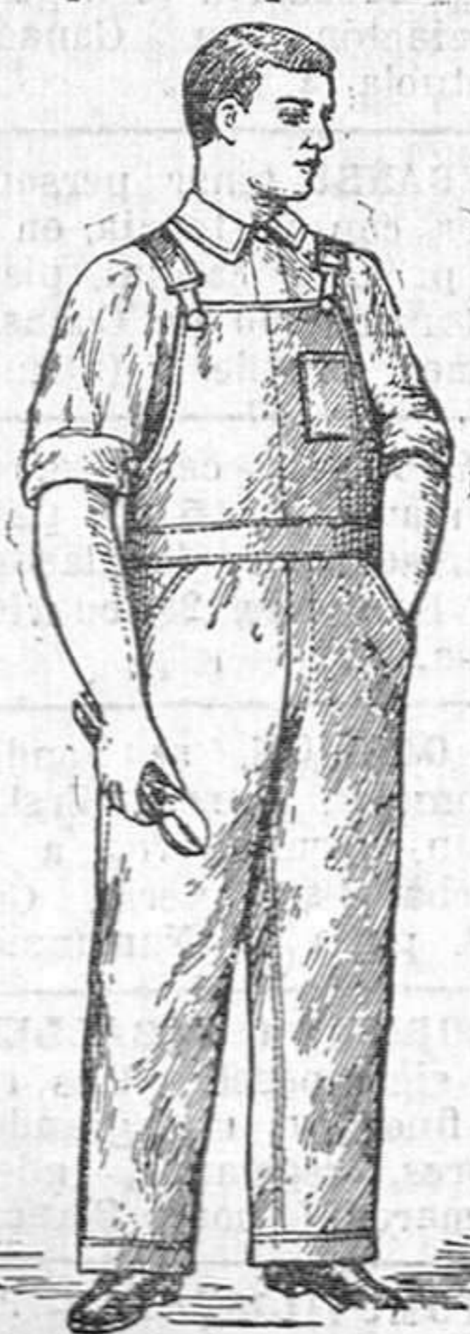
Precio: 12'50 pesetas.

Los más prácticos. Los más económicos, por ser su duración cuatro veces mayor que cualquier otro.