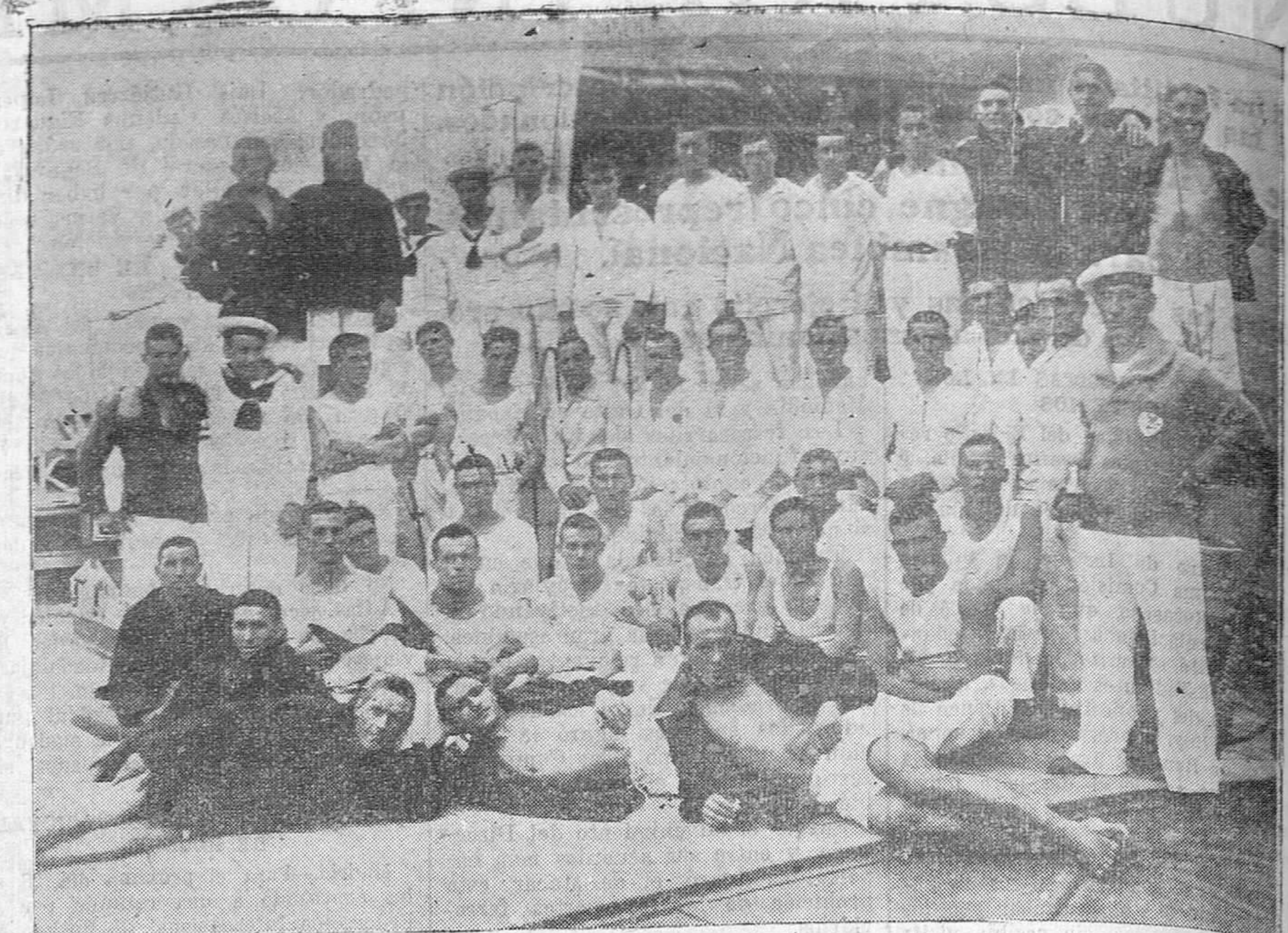
La marinería de los buques de guerra que tomaron parte en las regatas recientemente celebradas.