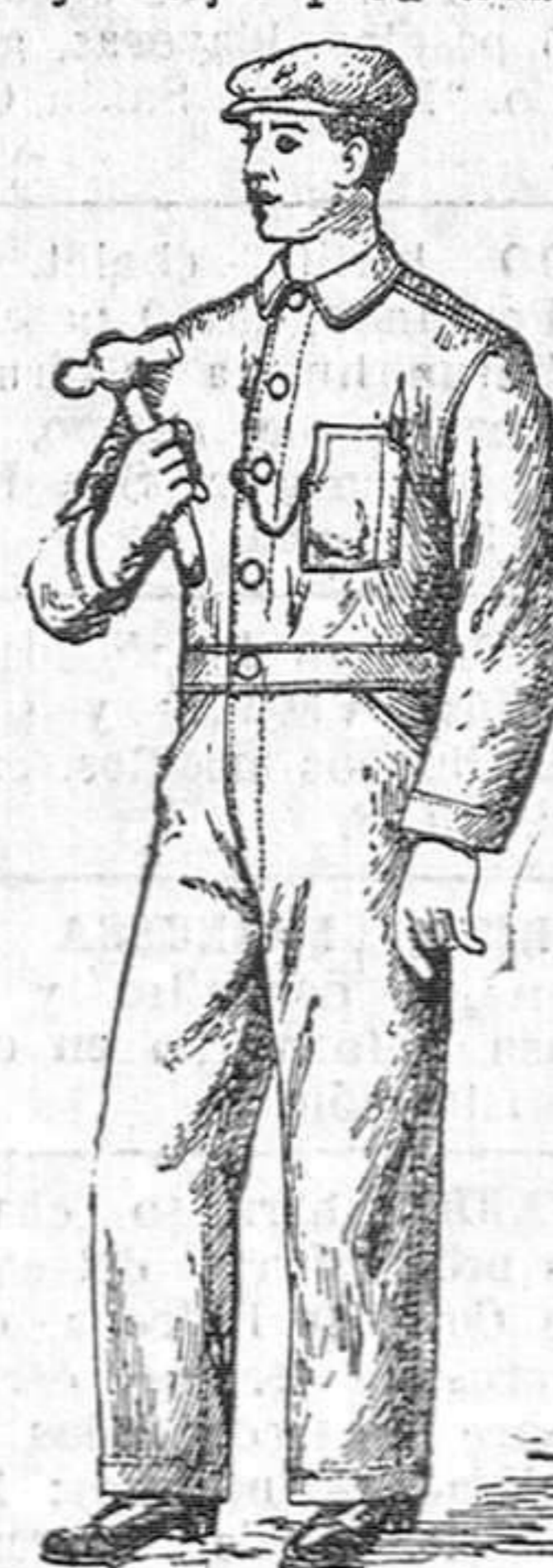
Precio: 18 pesetas.

Deben llevarlos todos los mecánicos, carpinteros y obreros en general, por ser el traje mejor para trabajo.