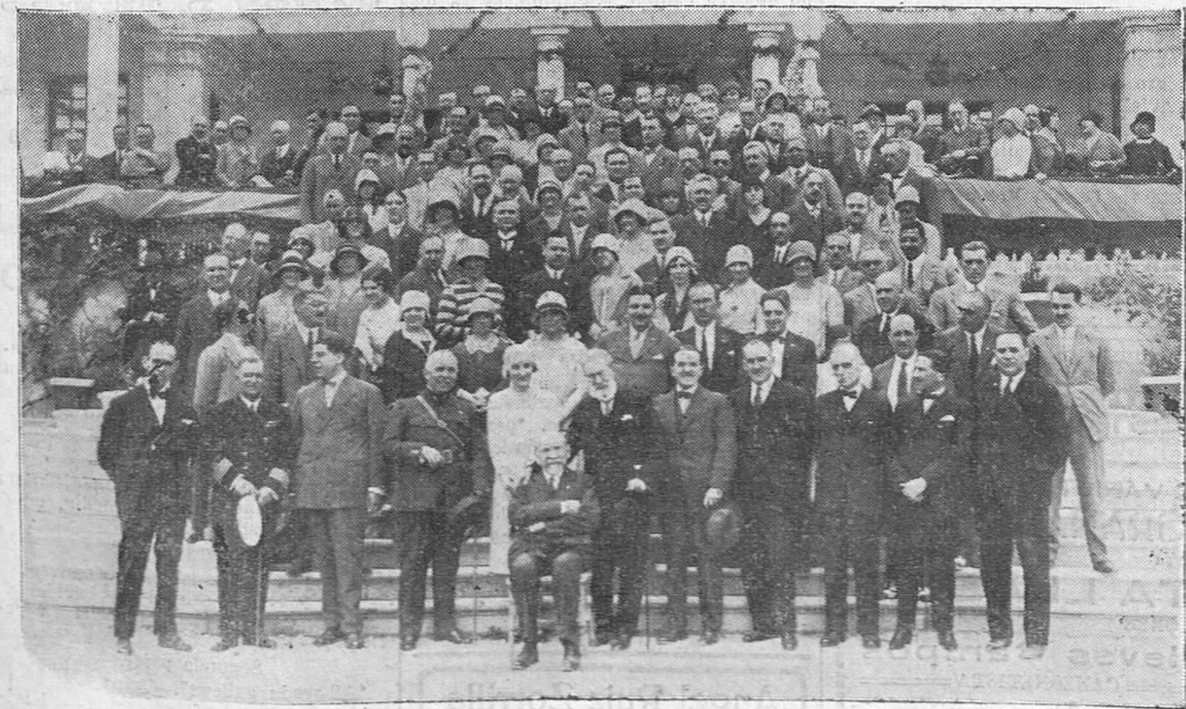
Los doctores nacionales y extranjeros, con las autoridades y médicos santanderinos, en su visita al Sanatorio Cantabria, donde fueron obsequiados con un espléndido banquete.

SARDINERO-SANTANDER Raquítismo, escrófula, linfatismo, tumores blancos ESPLÉNDIDA SITUACION + TODO CONFORT Las habitaciones preferentes tienen terraza independiente para la cura de aire y de sol ABIERTO TODO EL AÑO Dirigirse a DON JESÚS MATA MÉDICO-DIRECTOR