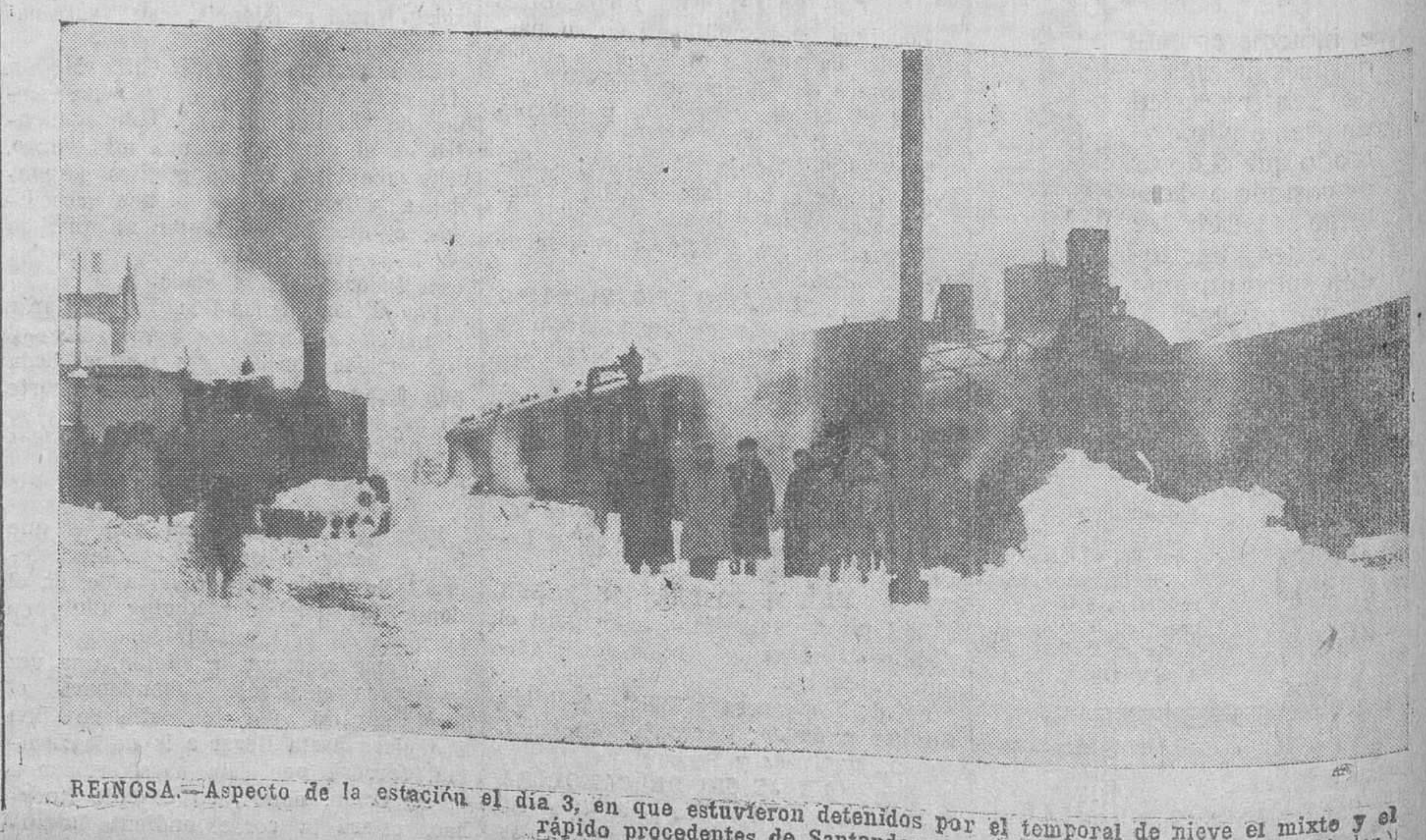
REINOSA.—Aspecto de la estación el día 3, en que estuvieron detenidos por el temporal de nieve el mixto y el rápido procedentes de Santander.