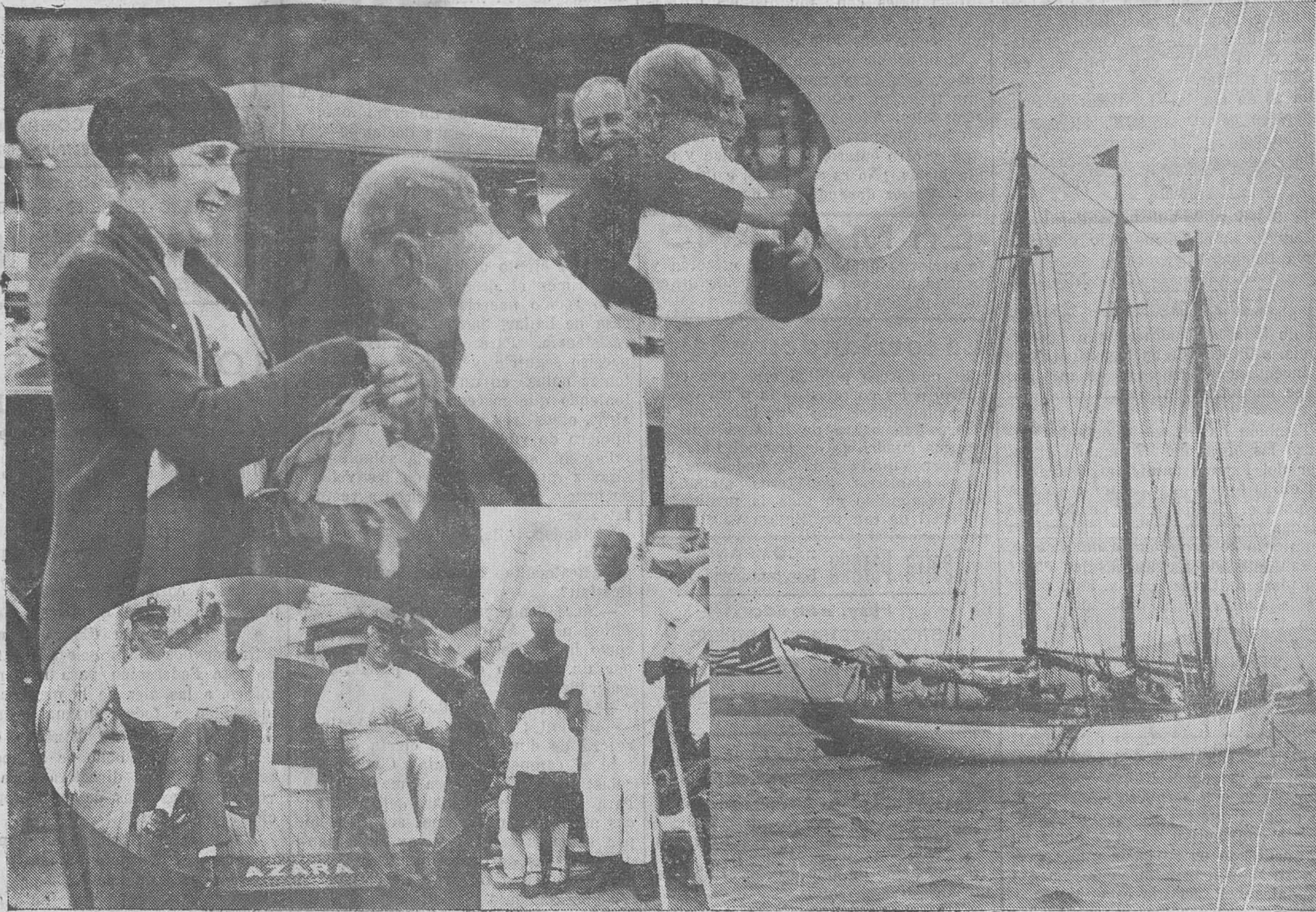
EL "AZARA", FONDEADO EN NUESTRA BAHIA. Su Majestad la Reina doña Victoria, en el momento de ser saludada por el señor Careaga, tripulante español del citado yate norteamericano. — El infante don Juan, abrazando al señor Careaga. — El capitán del "Azara", con su hermano. — El cocinero y su esposa, de raza de color, del mencionado yate.

otras ciudades argentinas, consiguiendo—como señalamos oportunamente—un gran éxito de crítica y siendo algunos de los cuadros adquiridos para Museos de la República Argentina.