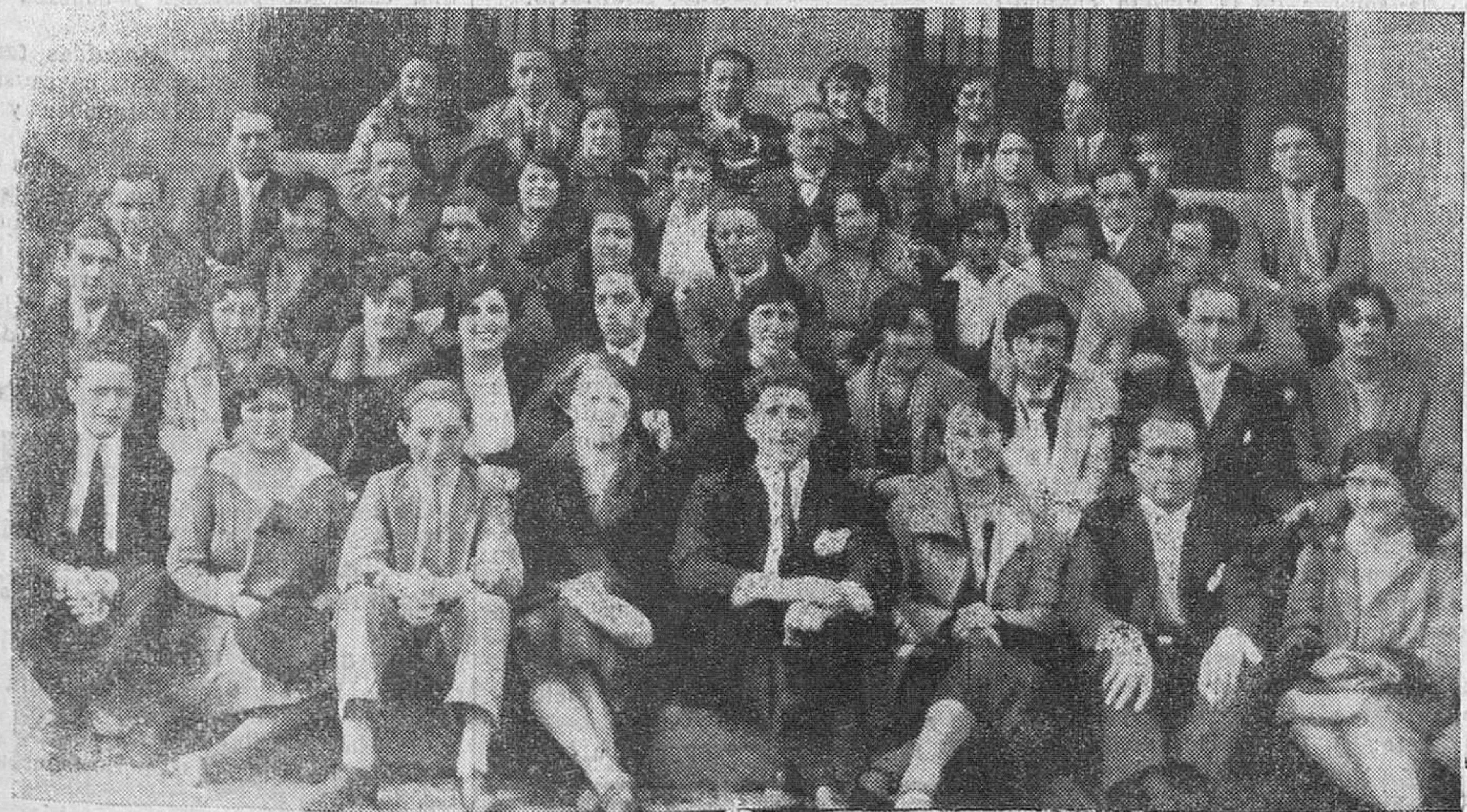
REINOSA.—Nutrido grupo de socios de la Tertulia Artística, recientemente inaugurada, y en la que figuran bellísimas señoritas de la capital campurriana.

A la una de la tarde el mar estaba imponente, no cesando en su aspecto furioso hasta que amainó el viento Sur, en las primeras horas de la noche. El espectáculo era grandioso e imponente. Como la marea era muy alta, el agua casi rebasaba los muelles. De vez en cuando un fuerte golpe de mar saltaba por las rendijas, llegando hasta el centro de la carretera. Tan continuados y violentos eran los golpes, que en algunos sitios las maderas se levantaron. Saltaba también el agua a todo lo largo del