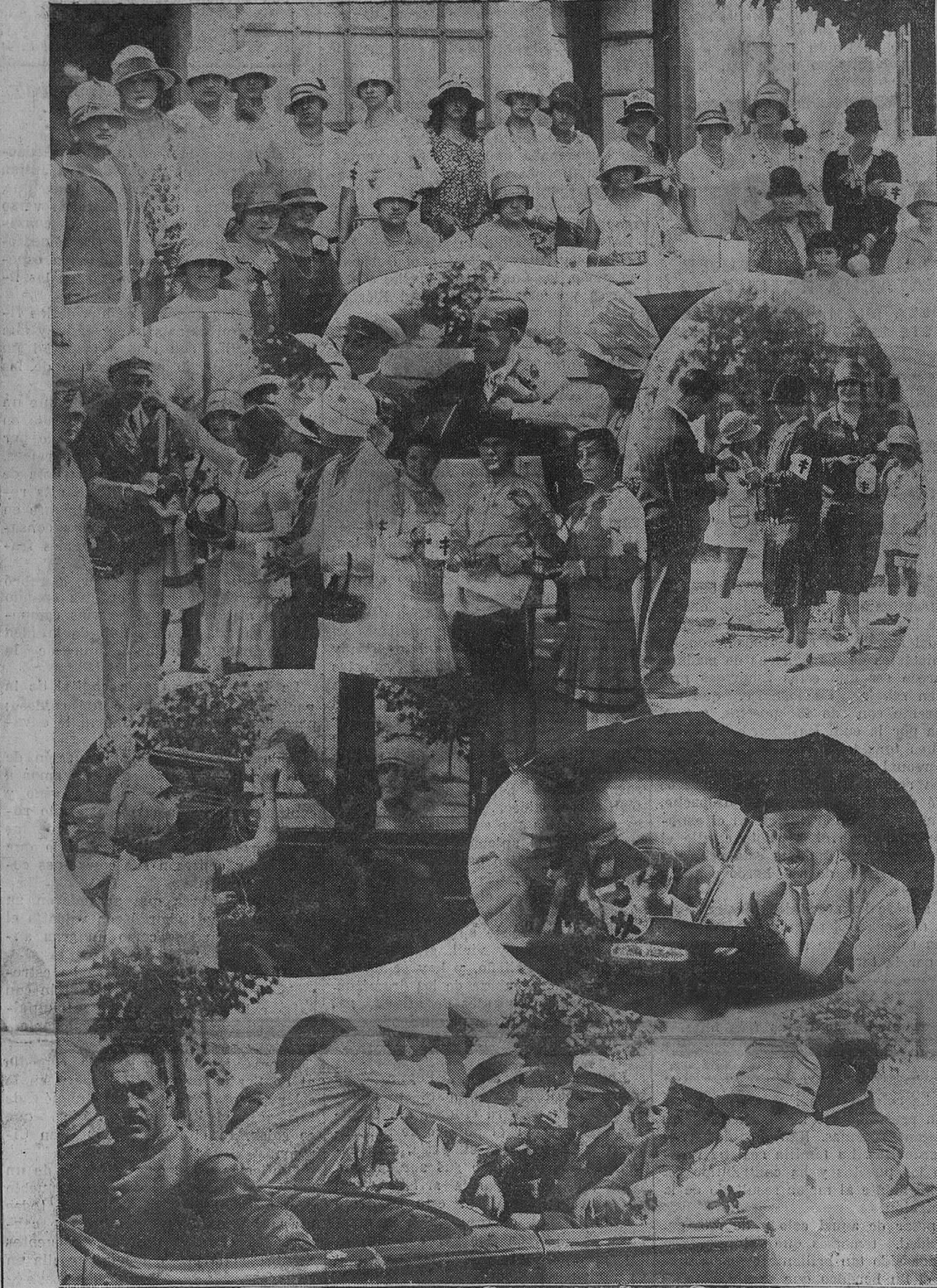
DE LA FIESTA DE LA FLOR.—Varios momentos de la simpática fiesta celebrada ayer, en la que tomaron parte activa nuestros augustos huéspedes, que recorrieron los puestos, haciendo espléndidos donativos.