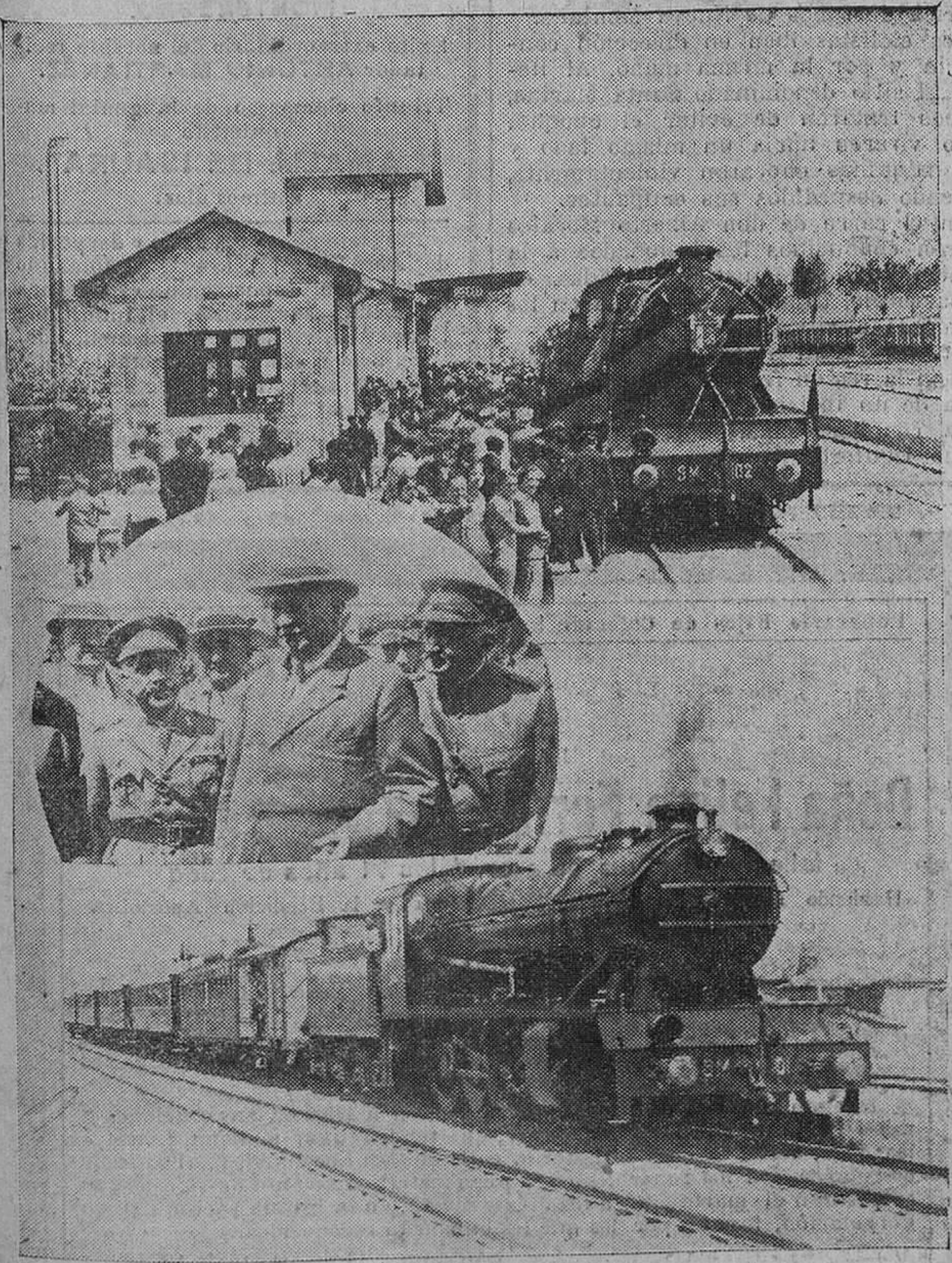
BURGOS. EL NUEVO FERROCARRIL SANTANDER-MEDITERRANEO. INAUGURACION DEL TROZO BURGOS-SALAS DE LOS INFANTES, VERIFICADO AYER, POR LA MAÑANA.—La máquina, entrando en la estación de Salas.—El general Primo de Rivera, que asistió a la inauguración, y el tren en el momento de regresar a Burgos.

Mañana, lunes, a las diez y media, tendrá lugar, en el local de la Colonia Burgalesa (Alameda Primera), una reunión de todos los palentinos, asociados ó no, para tratar asuntos afectos a la Colonia.