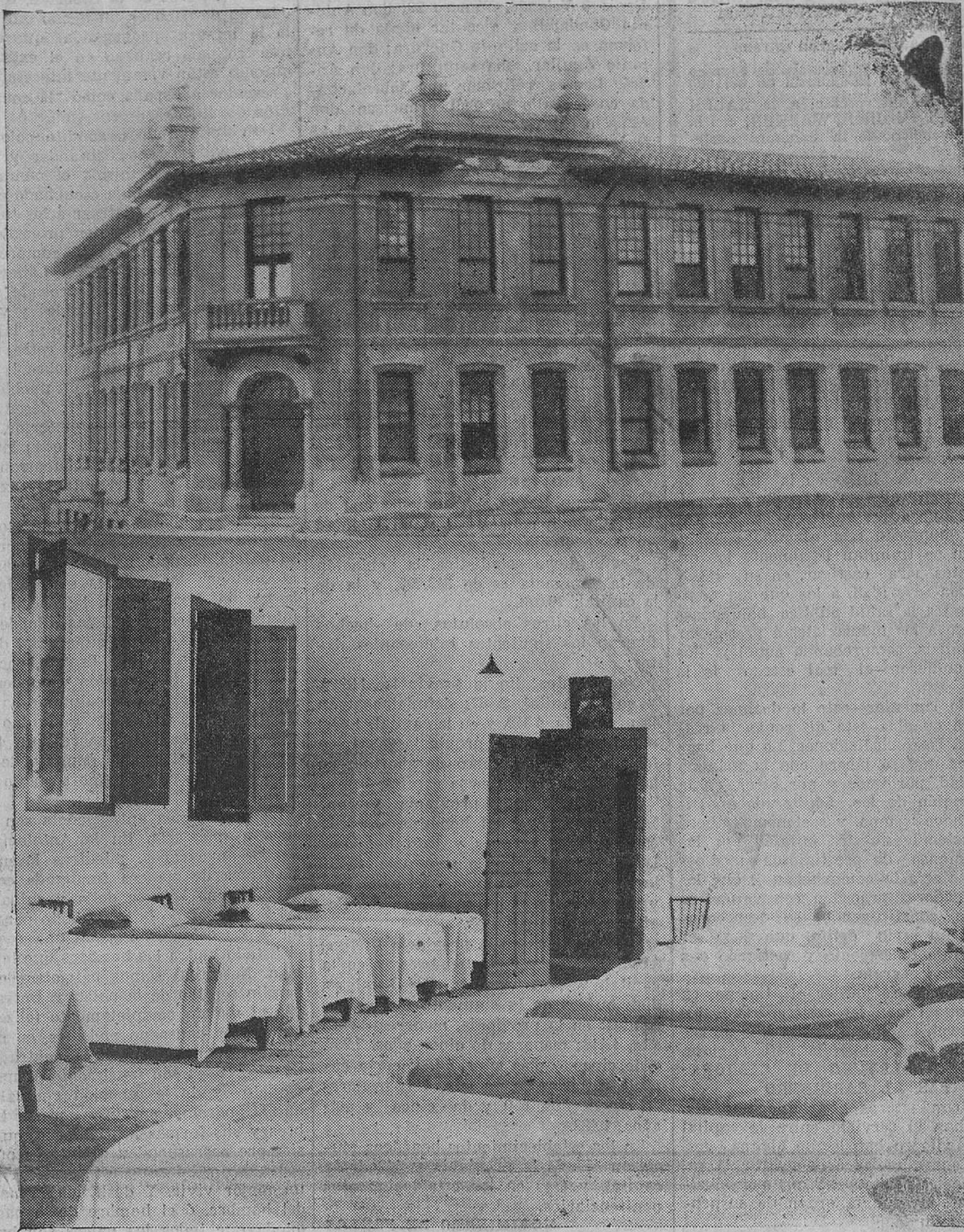
EDIFICIO DE ASILO NOCTURNO Y SALA-DORMITORIO DE HOMBRES, QUE EMPÉZO A FUNGIONAR EL DIA 21, EN EL ASILO DE LA CARIDAD.—Este edificio, dotado de duchas, lavabos, baños, cuartos dormitorios, clausura de las Hermanas que le rigen, despacho de dirección y sala de visitas, inmejorablemente situado y ventilado, es un excelente refugio para los pobres indigentes que allí buscan albergue.